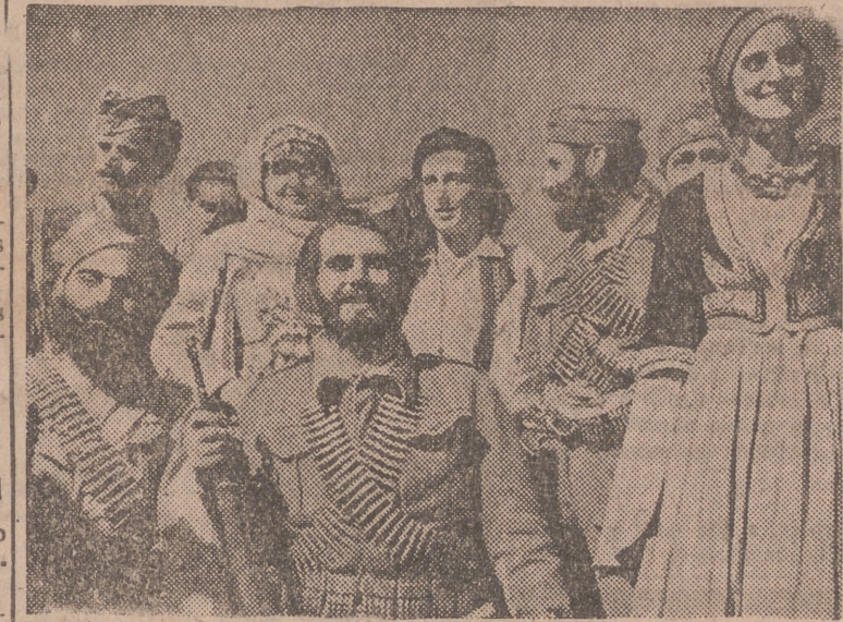
Muchachas y hombres griegos pertenecientes a un grupo de guerrilleros.

Londres, 12.—La Agencia Reuter recoge el siguiente mensaje de un enviado de la Radio norteamericana en Atenas: