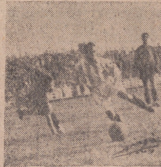
Caro burla a la defensa contraria y se dispone a centrar.