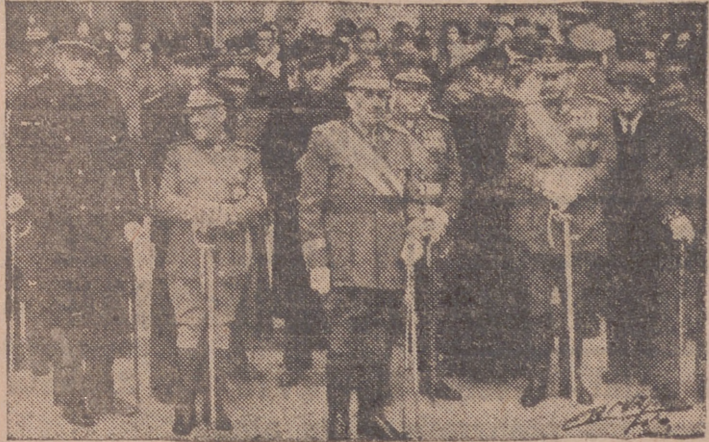
Autoridades militares y jerarquías en el acto celebrado por el Cuerpo de Intendencia.