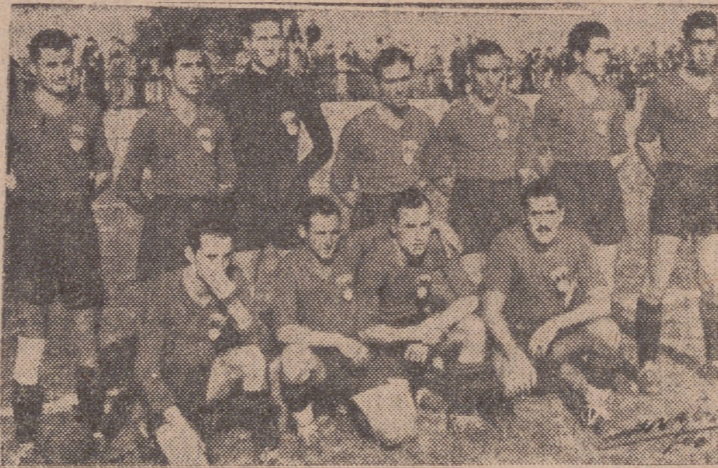
EQUIPO DEL ANAYA