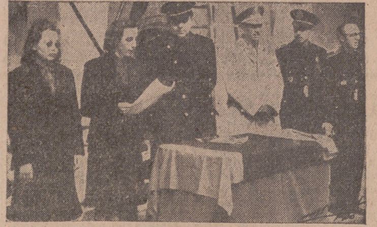
Presidencia del acto celebrado por la Sección Femenina de Valladolid en la festividad de su Patrona.