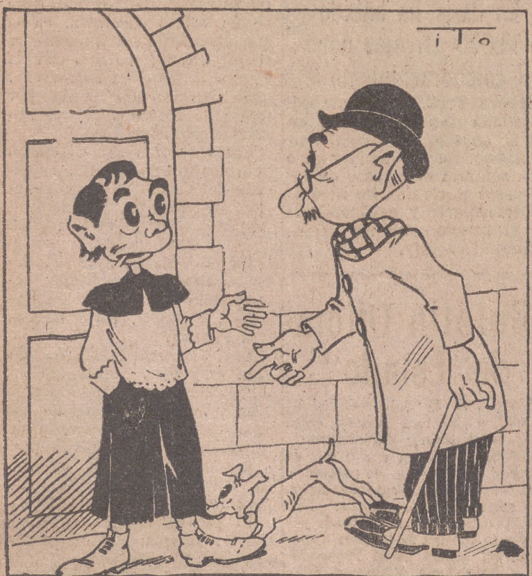
NINO DE CORO.—Por ITO —Yo canto en el coro; soy un «ceis». —Pues ya eres mayorcito, ¿no? —Sí, señor; pero es que soy un «ceis» doble. LORENZO GARZA

Estocolmo, 12.—El servicio telefónico público entre Berlín y Estocolmo se halla suspendido desde hace más de cuatro días. No se autoriza el tráfico general entre las dos capitales, pero se han efectuado algunas comunicaciones oficiales esta mañana.—Efe.