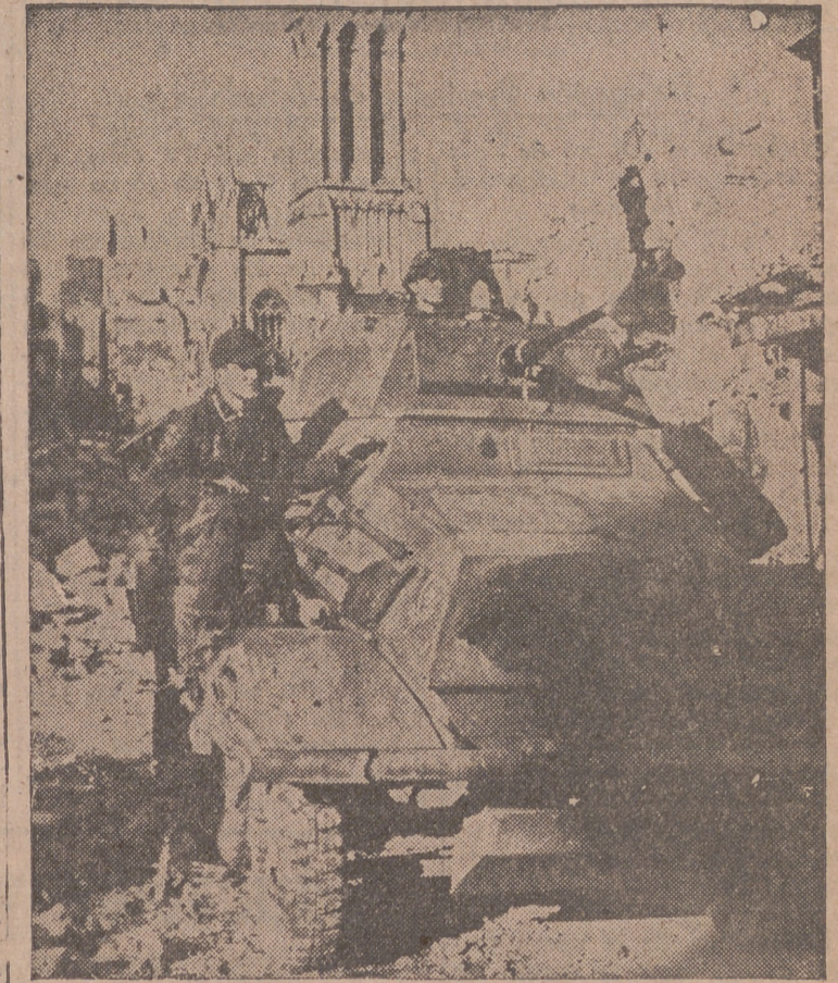
Un carro de asalto de la División de las S. S. "Juventud Hitleriana", atravesando una ciudad normanda destruida por las bombas de aviación.