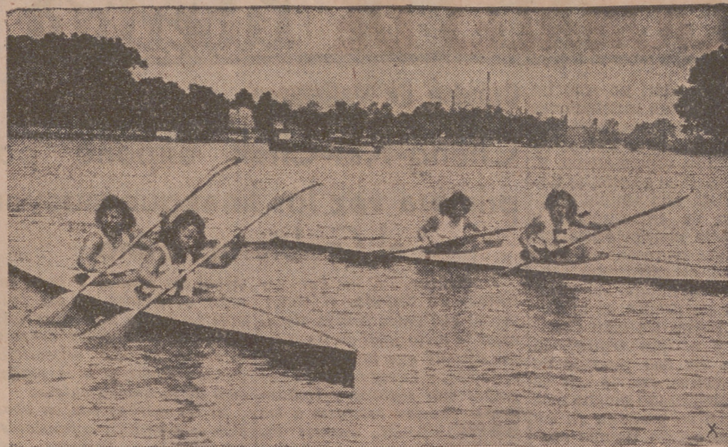
Un momento de las regatas femeninas celebradas recientemente en Alemania.