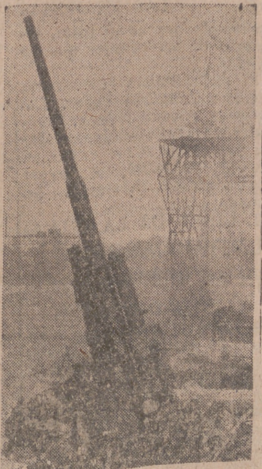
Las industrias y centros de importancia están protegidos por cañones de gran calibre.