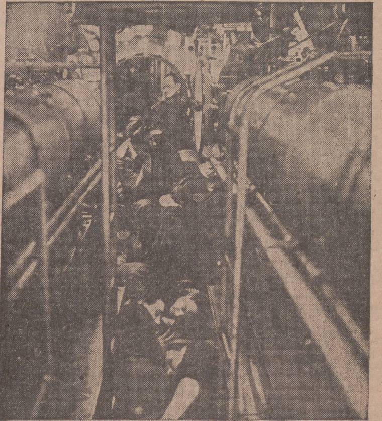
Los ratos de calma son aprovechados por los tripulantes para descansar, sin abandonar sus puestos.