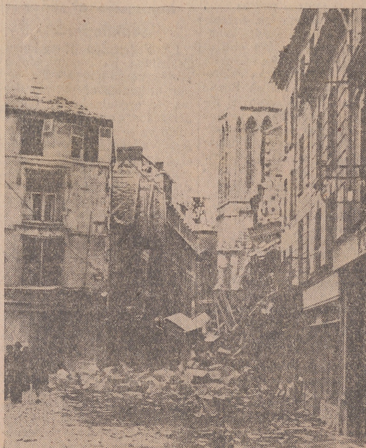
Una pequeña ciudad francesa duramente castigada por los bombardeos anglo-americanos

Chicago, 28.—Dewey ha sido designado candidato republicano para la presidencia de los Estados Unidos.—Efe.