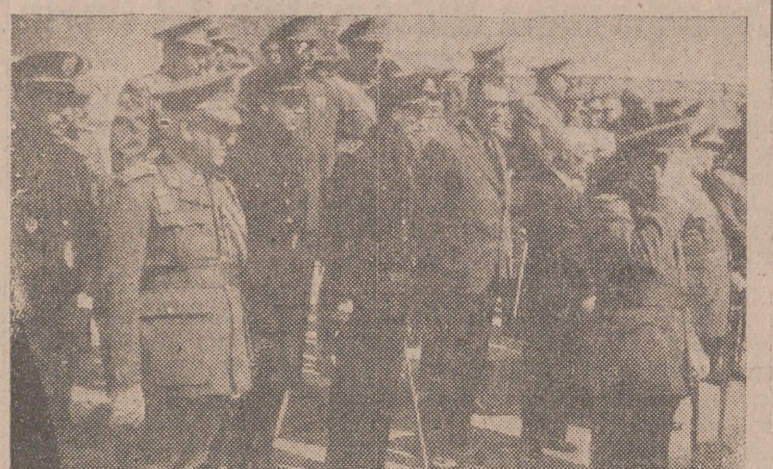
Autoridades que presidieron los actos en honor de San Fernando, Patrón de los ingenieros militares.

ron a la Sagrada Mesa más de cuatro mil personas. Durante toda la mañana, en coches particulares, taxímetros, autobuses y a pie, infinidad de personas siguieron llegando al Cerro desde Madrid y los pueblos de la Diócesis.