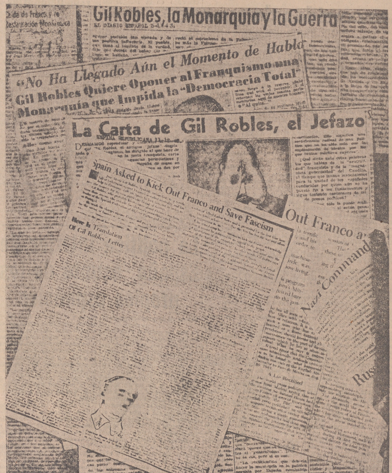
Facsimil en fotocopia de las manifestaciones de Gil Robles contra España, publicadas y comentadas: el 3 de diciembre de 1943, en «La Prensa», «Crítica» y «El Diario Español», de Buenos Aires; el día 12 de diciembre de 1943, en «España Republicana», y el día 3 de febrero de 1944 en «P. M.», de Nueva York, distribuidas por Alle Labor News, y cuya reproducción insertó el semanario bonaerense «Ahora» el 27 de abril de 1944. 1. Se publicó párrafos enteros del mismo escrito. 2. Quinto. El mismo día «El Diario Español» y «Crítica», ambos de Buenos Aires, lo comentan ampliamente. 3. Sexto. El día 4 los publica el «Baltimore Sun» y los comenta el «Hispanich New Letters», de Londres. 4. Séptimo. El día 11 de diciembre, bajo el título «La carta de Gil Robles, el jefazo», «La España Republicana», de Buenos Aires, la reproduce y comenta más extensamente todavía. 5. Octavo. El «P. M.», de Estados Unidos, la reproduce el 3 de febrero de 1944, repartida por la agencia norteamericana Alle Labor News.