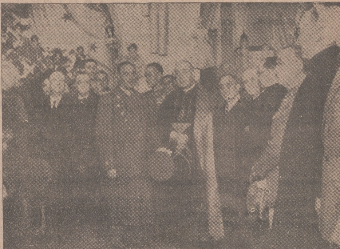
Autoridades que asistieron al acto inaugural de la Exposición de muñecas a beneficio de la Escuela-Patronato de la Casa de Beneficencia, esta ubicada en el Palacio Municipal