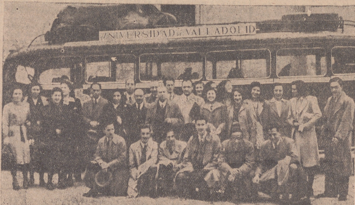
Alumnos de la Facultad de Filosofía y Letras de nuestra Universidad que ayer salieron en viaje de estudios para varias ciudades españolas.