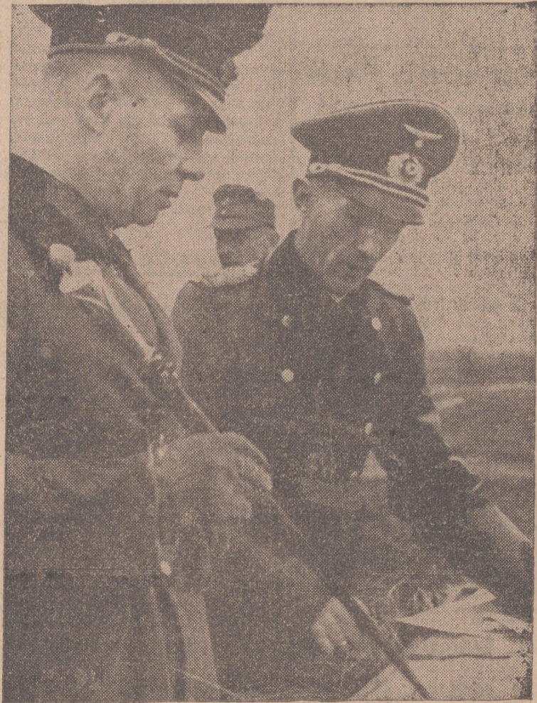
Rommel revisando en la costa fortificada del Canal de la Mancha los mapas que marcan los puntos invulnerables