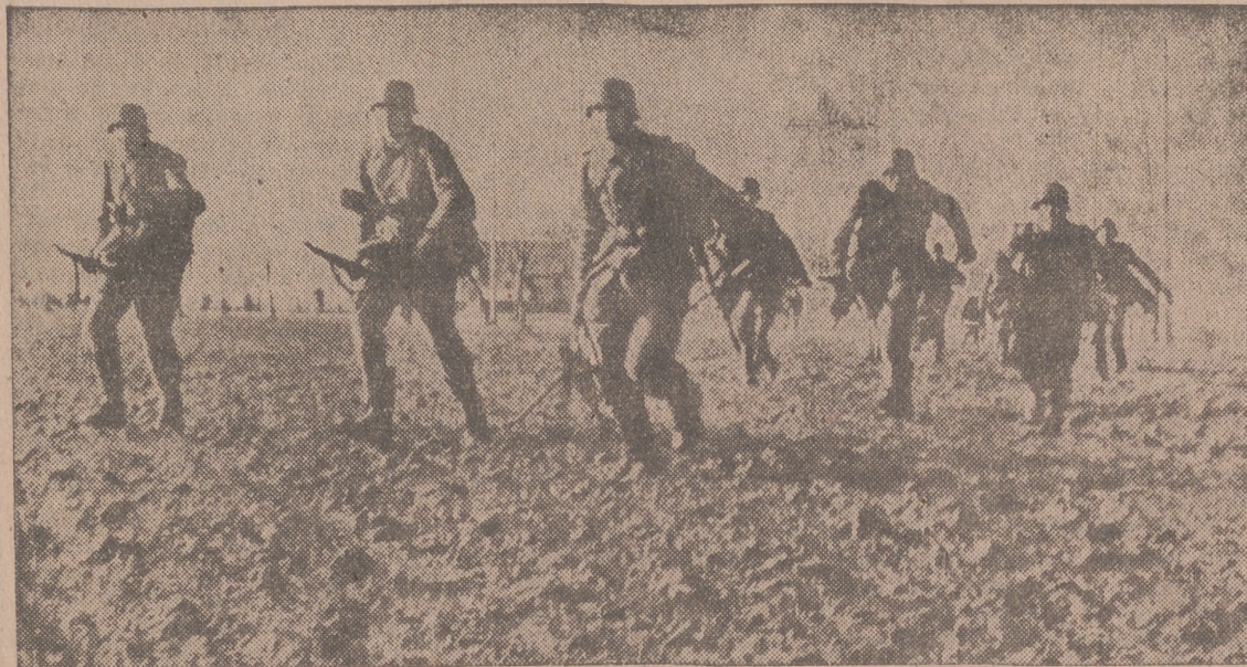
En la retaguardia del baluarte del Atlántico realizan continuas prácticas los soldados alemanes. He aquí un momento de su entrenamiento.