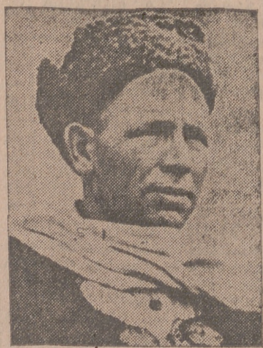
Un caucasiense que al lado de los ejércitos alemanes lucha en el Este con otros muchos compatriotas contra la tiranía y miseria bolchevique