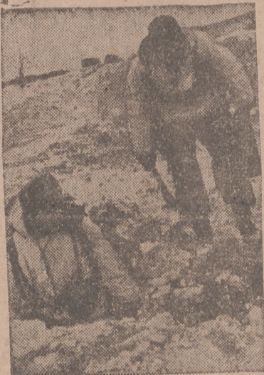
Las trincheras soviéticas son recorridas después del contraataque victorioso por los soldados alemanes.