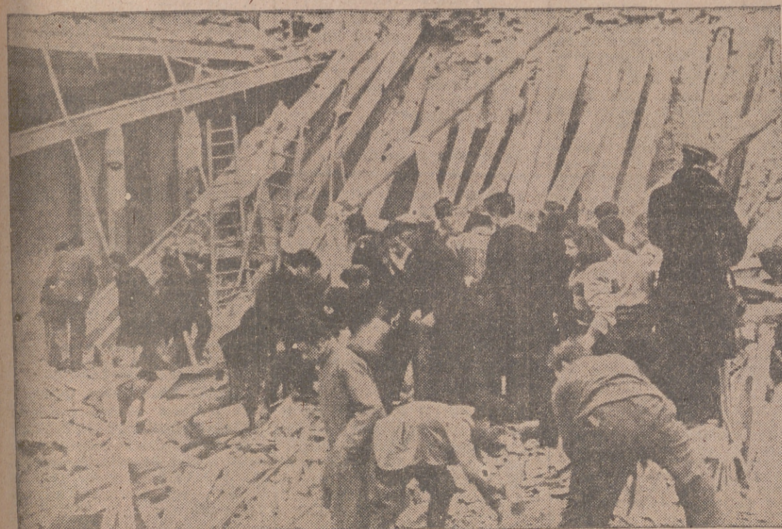
Numerosos ancianos, mujeres y niños habían buscado refugio en la residencia veraniega de Su Santidad el Papa. En la fotografía, los familiares de los refugiados buscan los cadáveres de aquéllos entre los escombros después del bombardeo anglo-americano.