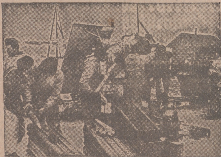
La posición enemiga es hostilizada por la artillería alemana hasta obligar a los bolcheviques a abandonarla.