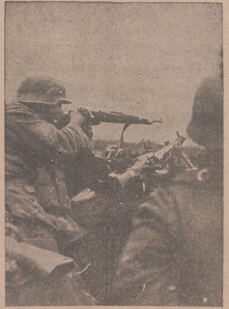
Un tirador especializado alemán ha localizado un objetivo.

Los 83 tetramotores derribados—dice—representan la exclusión de toda una escuadra de combate de los contingentes enemigos. Casi todos los tripulantes de los bombarderos destruidos perecieron al incendiarse sus aviones, en los que figuraban 800 ametralladoras del tipo más moderno.—Efe.