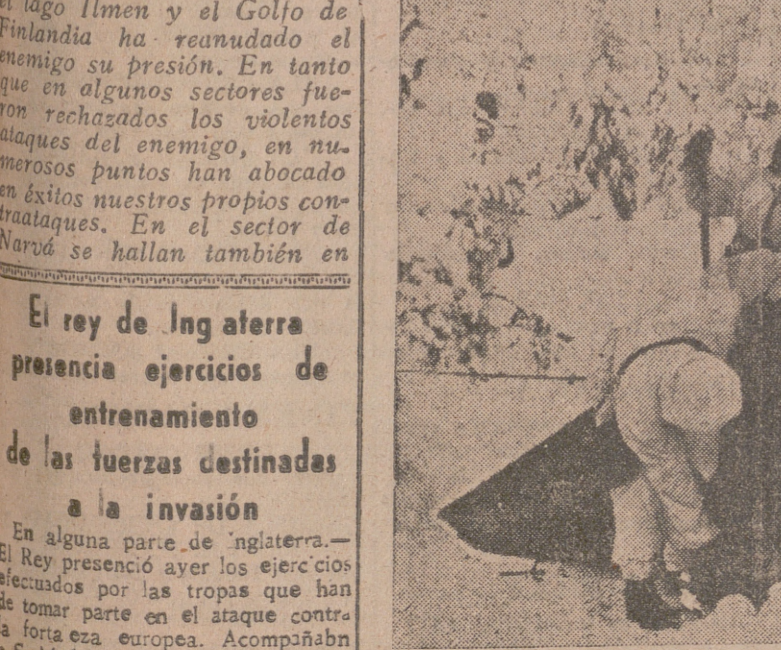
En una acción de patrulla, los soldados finlandeses tienen que hacer noche en un bosque. Rápidamente son colocadas las tiendas de campaña.