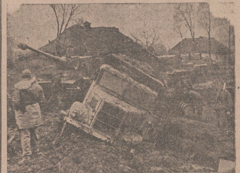
Un camión de transporte alemán, en su avance, ha quedado sepultado en el fango de una carretera rusa. Un tanque se acerca para sacarlo a remolque.