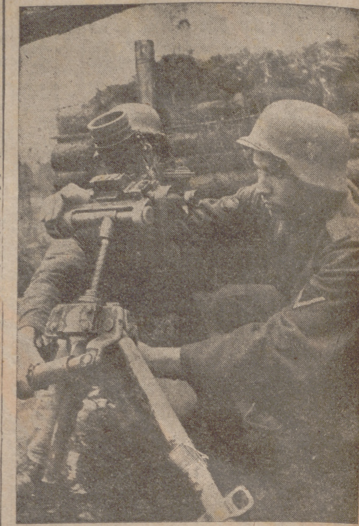
En el rostro de este granadero alemán se refleja toda la tensión que su importante misión requiere.