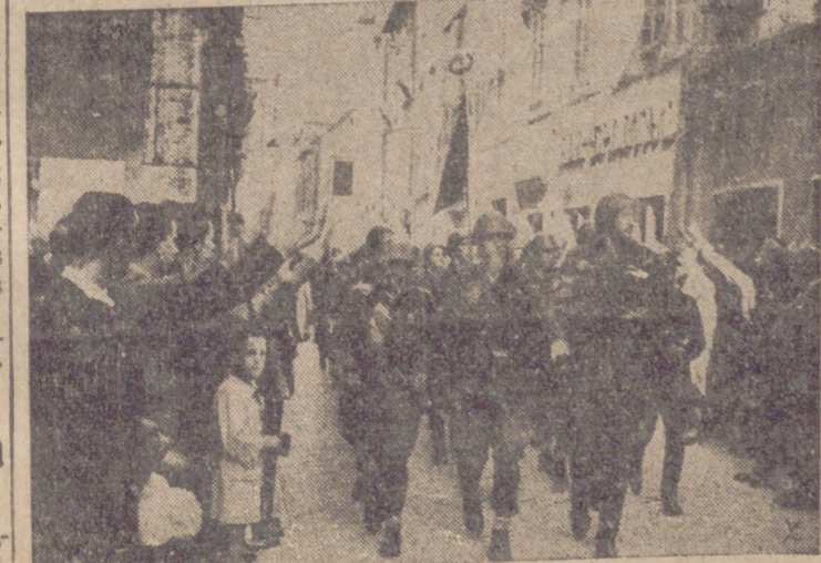
Bajo su enseña, desfilan unidades de voluntarios fascistas italianos por las calles de una ciudad