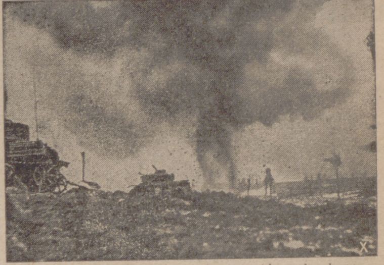
Los zapadores alemanes hacen saltar una mina colocada por los bolcheviques