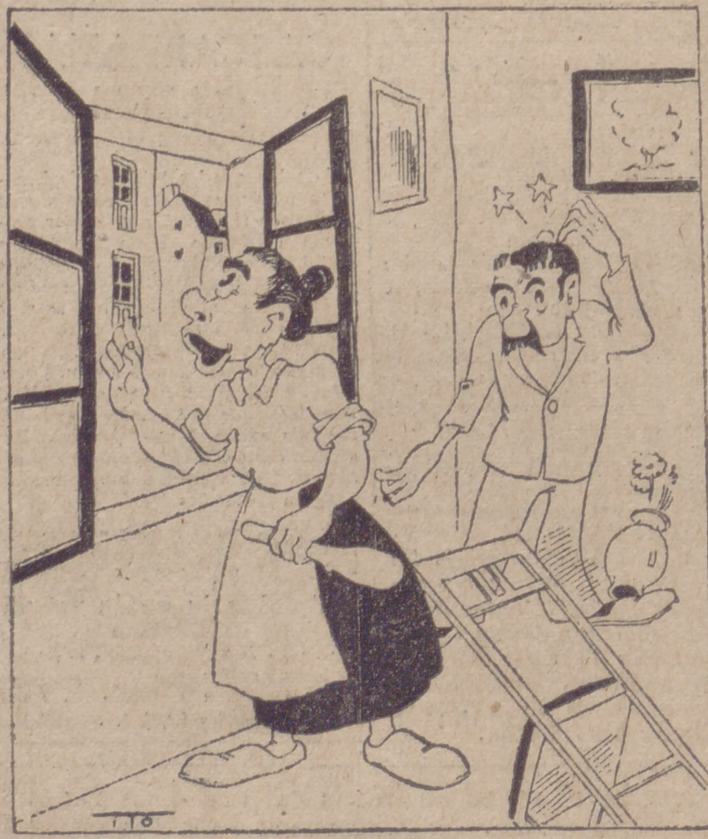
EL DIA DEL INOCENTE (Por ITO) Oiga, vecina, haga el favor de no hacer ruido, que tengo un asunto confidencial!

En Nueva Guinea, las tropas norteamericanas, que desde Arápe atacan con dirección al este, han establecido contacto con las tropas japonesas que en días pasados veían rehuyendo el combate, despedazándose matemáticamente de los elementos avanzados del general Krueger para ocupar posiciones ventajosas para la defensa. Hasta ahora no se tiene noticia de que se produjesen combates de importancia el domingo, ya que los japoneses no han reaccionado hasta el punto de contraatacar en algún sector, y las fuerzas aliadas continúan en período de reagrupamiento con vistas a los próximos combates contra los destacamentos japoneses que defienden los accesos de Gasmala y Rabaul, bases ambas que ayer fueron atacadas por aviones aliados, que arrojaron en total más de trescientas cincuenta toneladas de bombas contra dichas instalaciones, las cuales, sumadas a las arrojadas contra Cabo Gloucester en la misma jornada para preparar el asalto aliado, elevan a un total de más de setecientas toneladas las bombas empleadas contra las bases y puntos de partida del adversario.