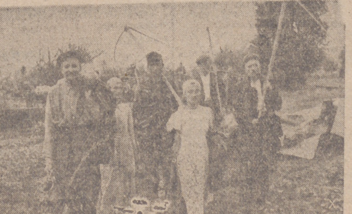
En las duras faenas del campo, los soldados alemanes ayudan a los campesinos rusos