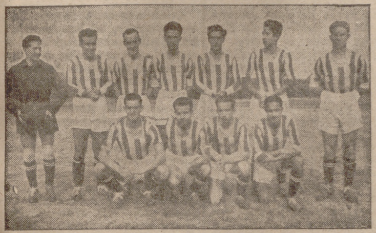
EQUIPO DEL LUISES-KOSTKAS