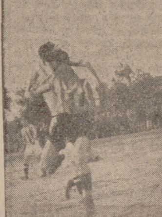
Un momento del partido.