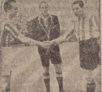
Cambio de saludos entre los capitanes de ambos equipos.