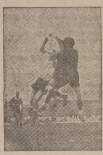
Una jugada del encuentro.