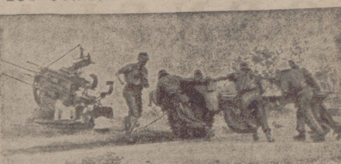
Artillería antiaérea alemana de cuatro tubos para proteger a las tropas alemanas contra ataques de la aviación.