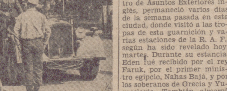
Un comandante de las S. S. alemanas recorre los puestos diciendo medidas, después de la detección de Badoglio.