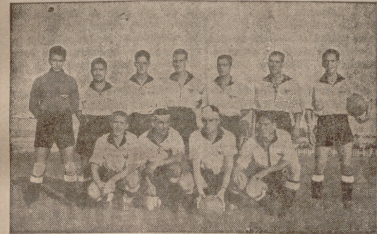
EQUIPO DEL ALAS-AMAIIKA