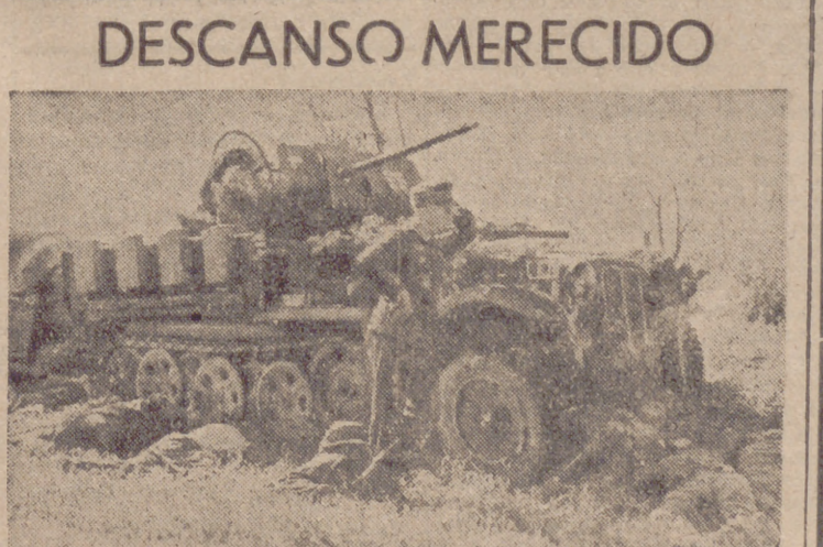
El combate fué duro y el breve descanso sirvió para dormir profundamente a la sombra del vehículo.