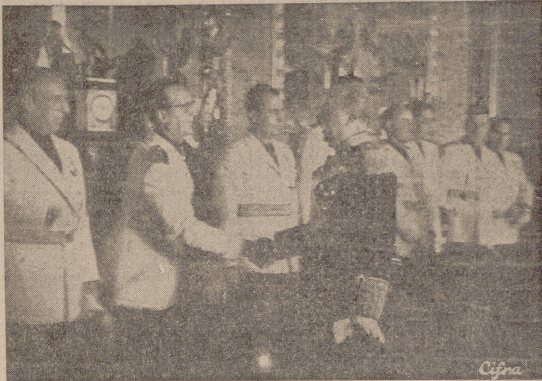
Su Excelencia el Jefe del Estado, Generalísimo Franco, saluda a las jerarquías del Partido durante la solemne recepción celebrada en Palacio.