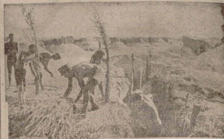
La caña, que se encuentra abundantemente en la cabeza de puente del Kuban, es usada por los soldados alemanes para la construcción de zanjas.