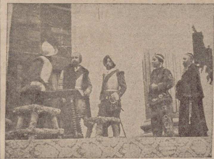
Una escena de la consigna "Pizarro", representada por el Teatro de Escuadra de Valladolid en la escalinata del Palacio de las Cortes.

El día 21 de septiembre, salieron para Madrid los camaradas que han participado en las diferentes especialidades y se han alojado en el gran Campamento instalado en la chopera del Retiro, capaz para 1.500 camaradas y en donde han convivido