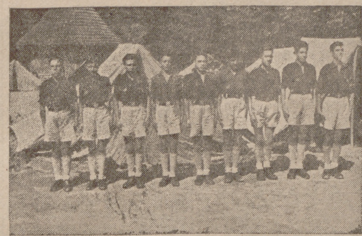
Una escuadra de Valladolid en el campamento del Retiro

Se han hecho ya clásicas las grandes concentraciones de las juventudes de la Falange en este simbólico mes de octubre, que, iniciadas con la de Sevilla en 1938, han ido patentizando, ante el asombro de los españoles, los resultados que en la tarea formativa de las juventudes que visten camisa azul se realizan en los cursos normales de la Organización. El año pasado fué junto a la piedra hecha símbolo y sepulcro de El Escorial, donde con ocasión de la clausura del Consejo Nacional y entrega de nombramientos, se celebró la concentración nacional en estas fechas de exaltación del Caudillo, Guía, Capitán y Conductor de las juventudes del yugo y del haz. Este año es en el corazón de España, en la misma capital madrileña, donde el Frente de Juventudes, orgulloso de sus tareas, las expone a todos los españoles en las magnas jornadas de la concentración madrileña celebradas en los últimos días de septiembre y que tienen su culminación en el gran desfile ante su Jefe las Falanges Juveniles de Franco en el Día del Caudillo.