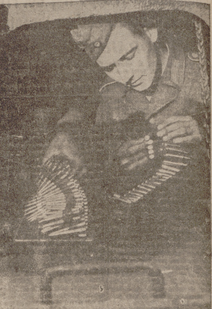
Soldado alemán preparando la munición para su ametralladora, que momentos después abrirá fuego contra el enemigo.