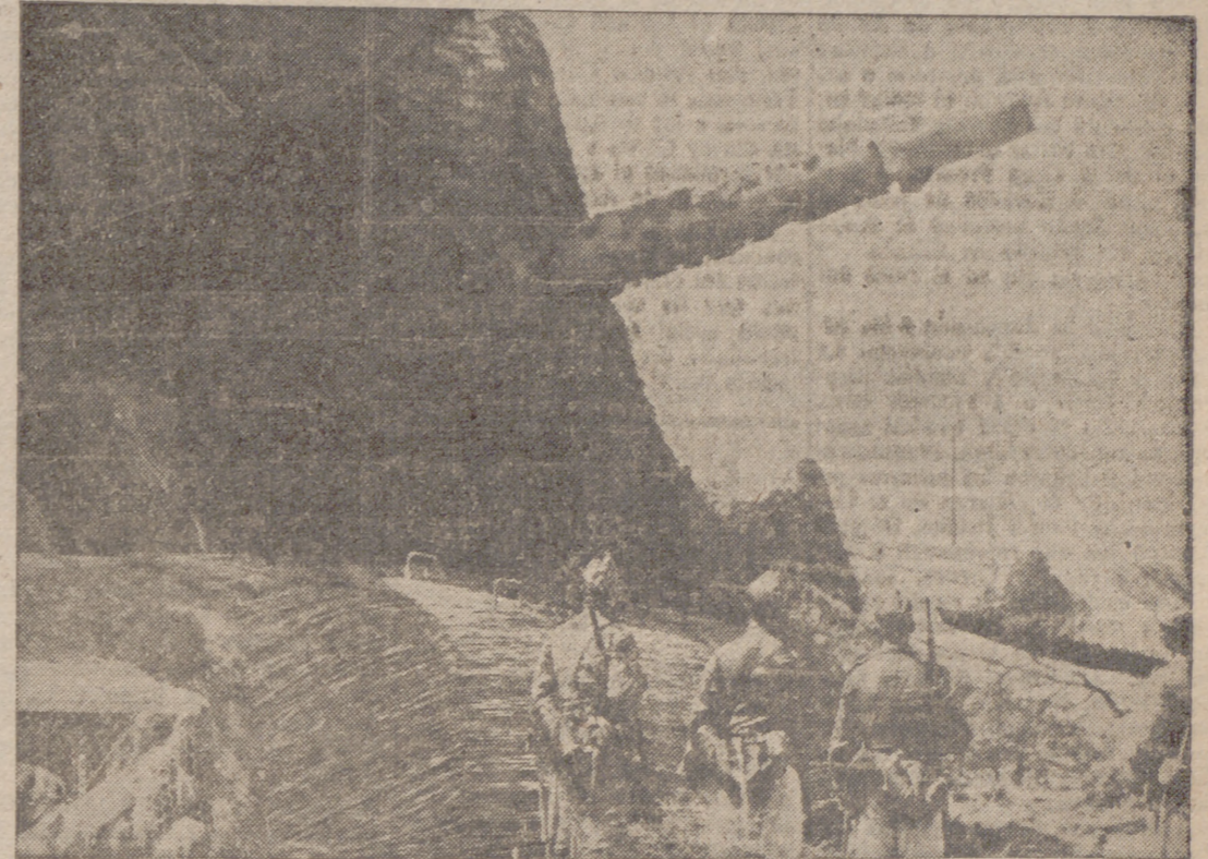
Soldados alemanes durante una visita a la costa del Canal, observan por primera vez ante sí a uno de los grandes colosales que componen la defensa de aquella costa.