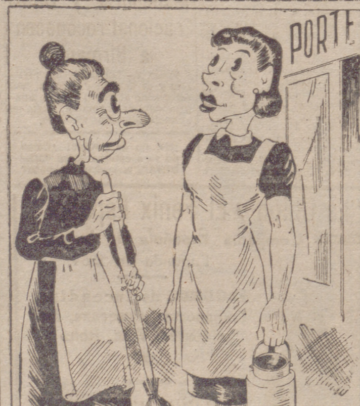
Vista... y a la vaca Por ITO —¿Qué, menos de comprar leche de "los Pajarillos"? —Sí, señora, sí. No sabe usted que allí no hay agua.

El Cairo, 2.—El comunicado aéreo del Oriente Medio dice: "Poderosas formaciones de bombarderos «Liberators» del noveno Ejército aéreo norteamericano efectuaron ayer un ataque coronado por el éxito contra las refineras petrolíferas de Ploesti, en Rumania. En el curso del ataque, efectuado con bombas explosivas e incendiarias desde alturas que oscilaron entre los 100 y los 500 pies, fueron alcanzados las destilerías, torres, depósitos, tanques y otras instalaciones. Fueron provocados enormes incendios, seguidos de violentas explosiones. La caza enemiga opuso tenaz resistencia sobre el objetivo y durante el viaje de regreso hostigó nuestras formaciones continuamente. Nuestros bombarderos tropezaron con intenso fuego de barrera anti-aéreo. En encarnizados combates aéreos han sido derribados por lo menos 35 aviones enemigos, entre ellos numerosos «Messerschmitt 109» y «Fockewulf 190». Veinte «Liberators» fueron derribados sobre el objetivo y todavía faltan va-