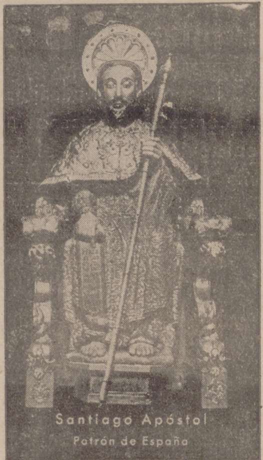
Santiago Apóstol Patroón de España