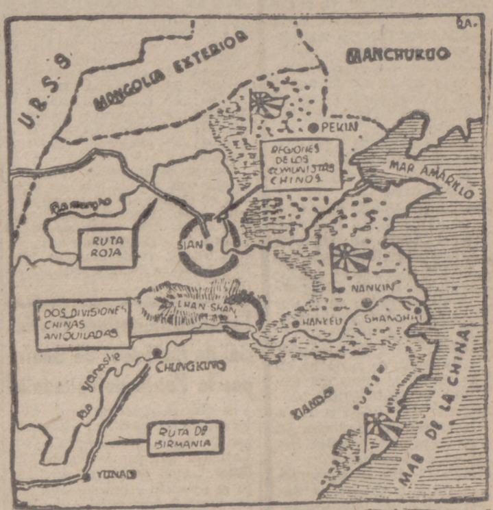
La guerra en China reviste varios aspectos; uno de los principales es la lucha contra los comunistas chinos, a los que el Japón se propone eliminar de la vida civil. En el mapa aparecen las regiones donde se asientan aquellos elementos perturbadores.