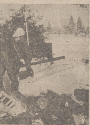
Una batería alemana de obuses se prepara para realizar un ataque por sorpresa