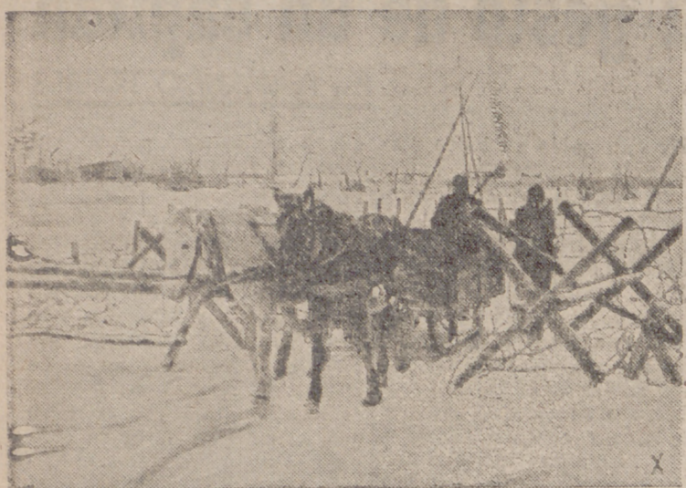
El suministro de una posición avanzada se realiza por medio de trineos. Este es el primero que atraviesa las alambradas, empresa peligrosa, cuando aún están batidas por el enemigo