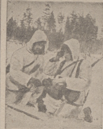
Estos dos soldados del Ejército alemán buscan entre la nieve las líneas telefónicas averiadas.