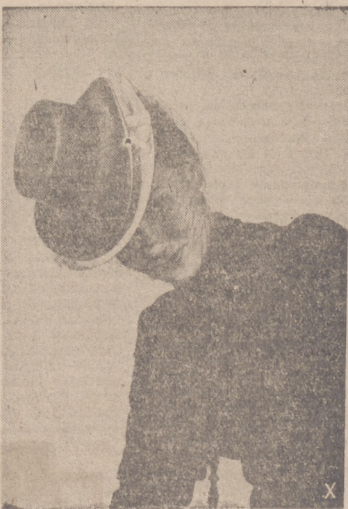
Elegantes modelos de sombreros lanzados recientemente por la moda para las mujeres europeas.