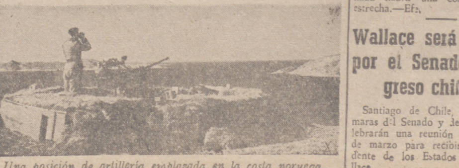
Una posición de artillería emplazada en la costa noruega.