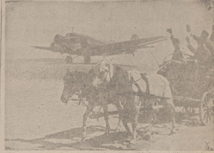
Un gran avión despegó y le despiden soldados auxiliares del arma aérea del Reich