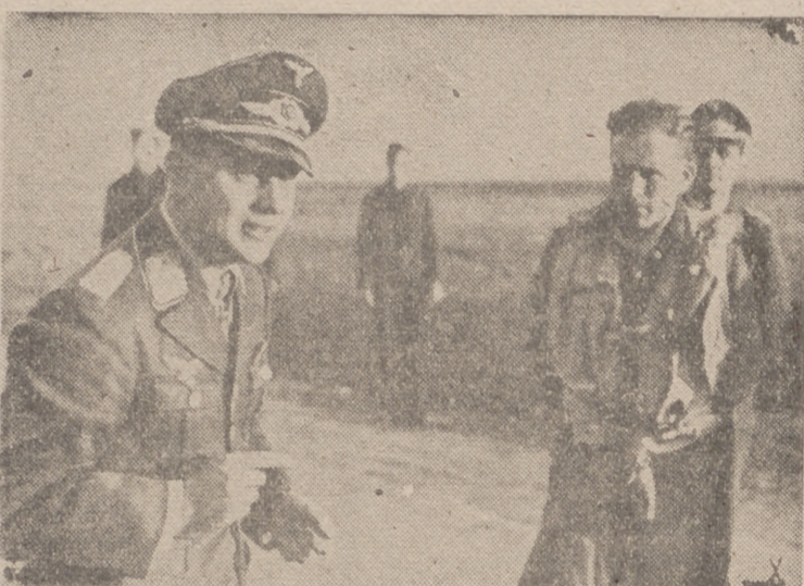
El comandante Priller, condecorado con las Hojas de Encina por sus grandes triunfos en el aire