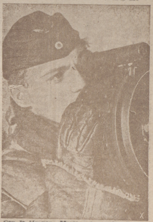
Con la lámpara Morse, este marino de un buque alemán lanza señales a través de la niebla para evitar posibles accidentes.