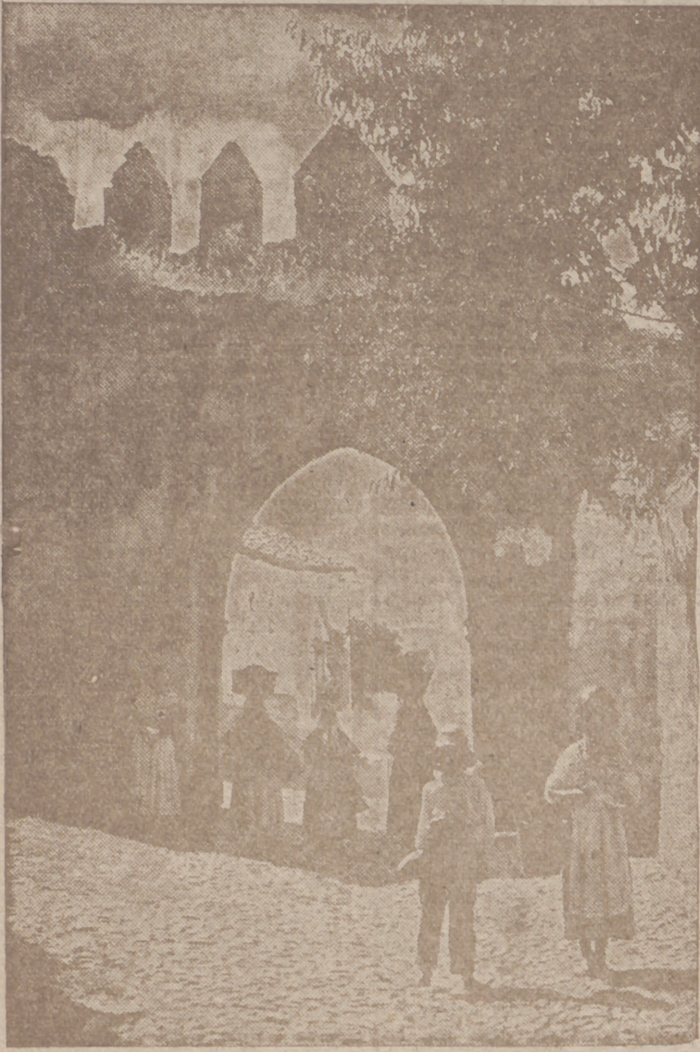
LA FAMOSA PUERTA DE TRUJILLO