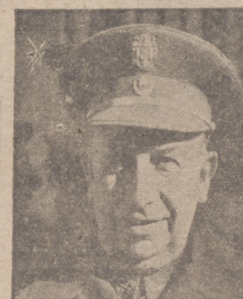
Excmo. y Rvdmo. señor don Enrique Pla y Deniel, Primado de España. El teniente general Orgaz