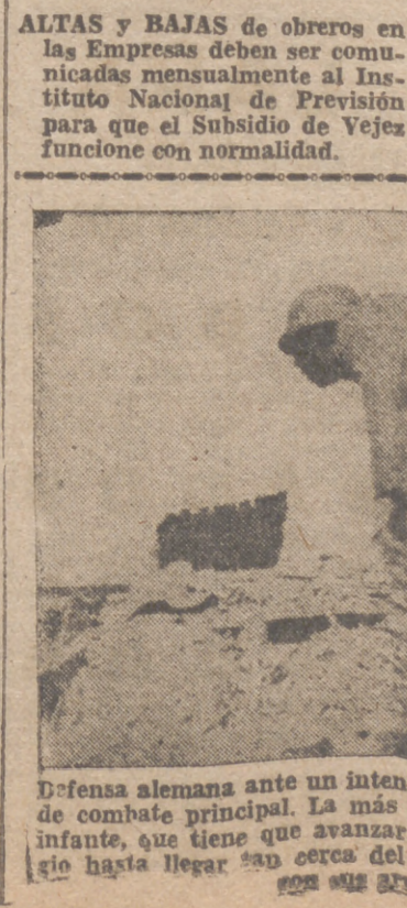
Defensa alemana ante un intento de asalto enemigo en la línea de combate principal. La más difícil tarea en esto la tiene el infante, que tiene que avanzar encorvado de refugio en refugio hasta llegar a los cerros del enemigo que pueda alcanzarle con sus armas ligeras.

ALTAS Y BAJAS de obreros en las Empresas deben ser comunicadas mensualmente al Instituto Nacional de Previsión para que el Subsidio de Vejez funcione con normalidad.