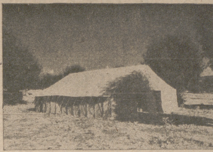
Tienda de gran tamaño en que tienen lugar las tareas de conferencias, estudios y demás trabajos propios del Consejo en el campamento de El Escorial