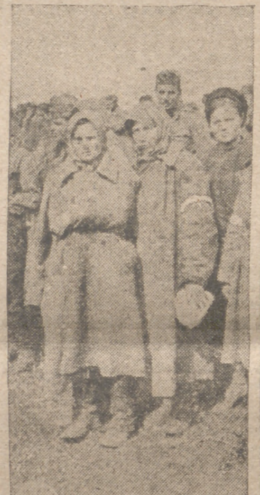
Entre los miles de prisioneros rusos se encuentran también las mujeres. Estas parecen estar acostumbradas a la nueva situación