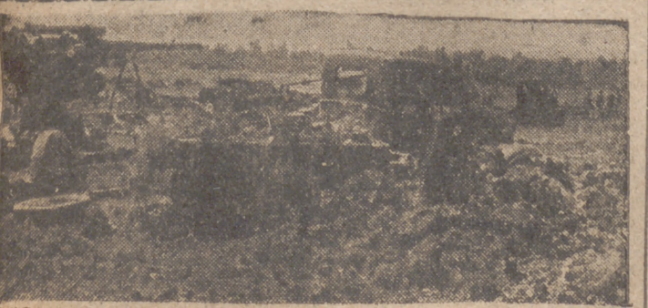
La Aviación alemana destruye con sus certeras bombas todos los vehículos y cañones de los soviets que inician su retirada en los frentes de Rusia.

Berlín, 24.—A 132 buques, con un total de 849.200 toneladas, incluidos los que figuran en el comunicado especial de hoy, se elevan las unidades enemigas hundidas en el actual mes de septiembre por submarinos alemanes y la aviación del Reich. Hundieron los primeros 607.000 toneladas y 242.000 los aviones. Los buques de protección en el convoy últimamente atacado, eran muchos más numerosos que los mercantes, lo cual demuestra—a juicio de los círculos competentes de Berlín—lo mucho que han sufrido los transportes enemigos en sus viajes hacia Murmansk.