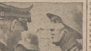
El capitán general Lindemann, jefe de un ejército, impone la Cruz de Hierro a los héroes del Wolchow

enfrentarnos con la resolución del problema que se nos plantea, e imprimiendo a sus palabras un sentido claro y elevado, termina diciendo: "Nuestra obra se hace con hombres enteros y eficaces, entregados totalmente a la tarea que se realiza". A continuación prosigue el camarada Anibal la exposición del tema de los instructores y habla de los tres grupos de enseñanzas que en la Academia han recibido educación política, premilitar y física, así como de la formación y espíritu falangista de estos muchachos que están ahora.