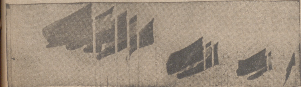
Franco dió ayer la consigna de que todos los españoles deben agruparse bajo las banderas de la unidad patria