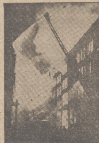
Tras los intensos bombardeos de los aparatos alemanes, el servicio de defensa entra en acción para extinguir los voraces incendios