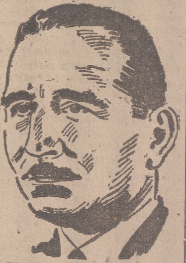
Bastico, nuevo mariscal de Italia, que manda las fuerzas de Africa del Norte

Siempre que España lo exija, el sacrificio de sus hijos se hará ostensible. Porque así hemos sido, somos y seremos. Caídos del Cuartel de Simancas: ¡Presente!