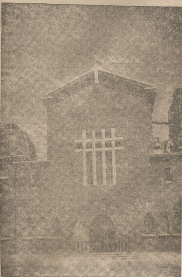
Fachada principal de la nueva iglesia

la que ambos gozan del cariño y admiración de los miles de feligreses de la parroquia.