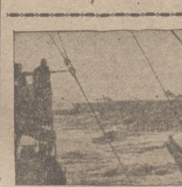
Convoy de mercantes británicos fuertemente escoltado en aguas del Atlántico

En sexta página, crónicas de BERLIN, VICHY y LISBOA