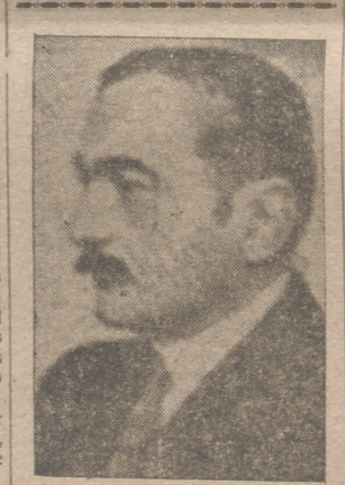
Durante su visita al Cuartel General del Führer le fué con- cedida por Hitler al presidente del Consejo de ministros, Von Kaib, la Gran Cruz de la Orden del Águila alemana.

El triunfo de Von Bock es lo que ha inducido hoy al Ministerio de Propaganda a caracterizar la actual situación señalando, en primer término, la sorpresa que ha causado al mundo el hecho de que Alemania pudiera poner en pie de guerra fuerzas como las que han entrado en juego en el sector Sur, donde, además, han aparecido nuevas y modernas armas. Tras estos, se ha deklarado en la conferencia de Prensa, que la flota submarina de las potencias del tripartito no sólo ha aumentado, sino que controla todas las rutas, y aquí se ha citado, por