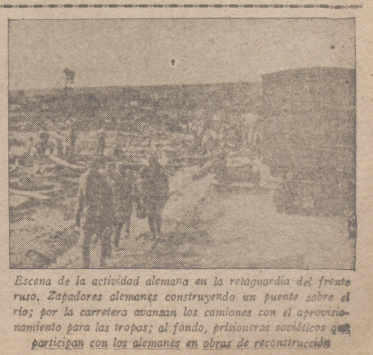
Escena de la actividad alemana en la retaguardia del frente ruso. Zapadores alemanes construyendo un puente sobre el río; por la carretera avanzan los camiones con el aprovisionamiento para las tropas; al fondo, prisioneros soviéticos que participan con los alemanes en obras de reconstrucción

LA MARINA JAPONESA INTERVIENE EFICAZMENTE EN LA REGION DE WENCHAU Tokio, 15.—Unidades de la Marina Japonesa realizan operaciones en gran escala, en colaboración estrecha con las fuerzas de tierra, frente a la región de Wenchau, comprendidos Wukiang y Fei Yau Kiang. Además, los barcos de guerra nipones y otras embarcaciones han dragado las minas en aguas de Wenchau y han bombardeado las posiciones fortificadas de los chinos.—Efe.