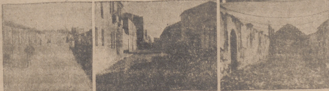
1. Estado en que quedó la iglesia de las Delicias después del último incendio.—2 y 3. Aspecto de dos calles (Pura y Travesía del Marqués) donde dos viejos muros impiden la circulación