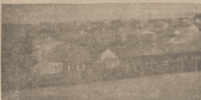
Vista general del barrio de las Delicias

nos referimos concretamente a la pasarela que cruza el ferrocarril para dar acceso único a la barriada. La pasarela es el enlace único de comunicación entre las Delicias y la capital, pero se da el caso de que los habitantes de la barriada tienen fundamentado motivo de utilizar la pasarela, por las malas condiciones en que ésta se encuentra, constituyendo un verdadero peligro el estado de abandono en que se halla.