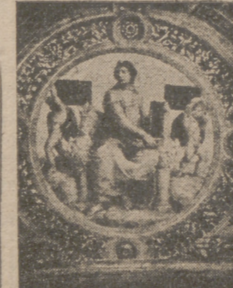
La Filosofía. Alegoría por Rafael Sanzio (Estancia de la Signatura, Vaticano, Roma)

Habría que averiguar qué trastornos han podido ocurrir en los más hondos senos de la sociedad para que ésta sea capaz de entusiasmarse, deliberada y conscientemente, con el error.