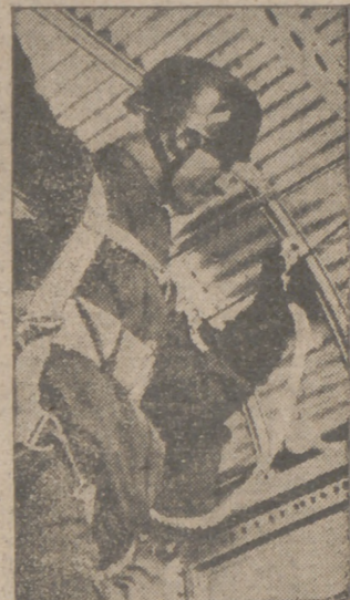
Un paracaidista alemán, momentos antes de su salto al vacío