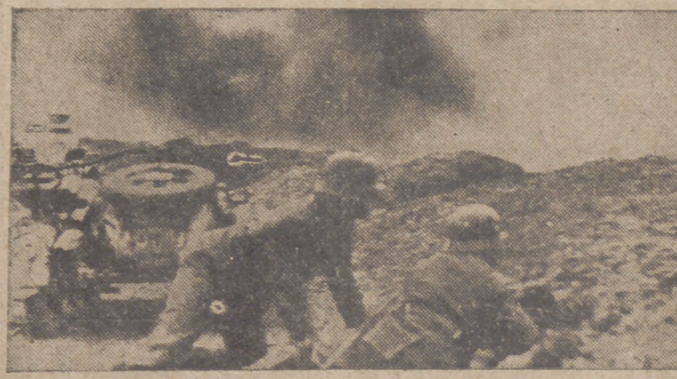
Una sección motorizada alemana espera el momento de ataque, mientras los Stukas bombardean las posiciones de artillería del enemigo

Hoy por la mañana fué tomado al asalto el fuerte "Siberia", apoyado de forma sobresaliente nuestra aviación la acción de la infantería.