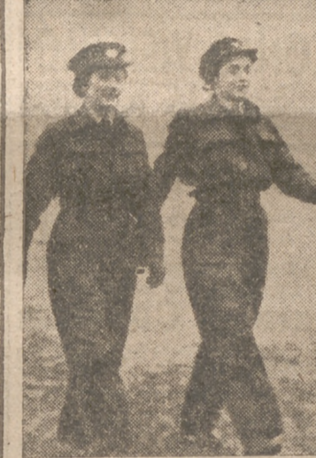
Mujeres inglesas que prestan servicios auxiliares, vestidas con su indumentaria de combate

ta cifra ha sido propuesta por los técnicos financieros, los cuales estiman que la suma de ciento setenta mil millones de dólares prevista en el actual programa de guerra es insuficiente para asegurar la construcción de la enorme cantidad de aviones, tanques y cañones fijada por el presidente Roosevelt. Este quiere que se fabriquen 185.000 aviones y 120.000 carros, pero el crédito previsto sólo está calculado para producir 125.000 aviones y 45.000 carros. Por otra parte, los técnicos declaran que el programa actual se basa en la existencia de un Ejército de 3.600.000 hombres, mientras que, en realidad, será preciso equipar un Ejército de siete u ocho millones de hombres, de los cuales dos millones pertenecerán a las fuerzas aéreas. Los gastos de guerra se elevaron durante el mes de marzo a 2.600 millones de dólares, pero se calcula que a fines del próximo año alcanzarán un