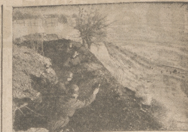
Un regimiento alemán vigila la costa del Mar de Asow

La victoria de Inglaterra constituiría para nosotros la esclavitud eterna, en tanto que nuestras esperanzas de libertad sólo podrán estar basadas en la victoria de las potencias del Pacto tripartito. Yo, que conozco bien a estas potencias, aseguro a mis compatriotas que sien-