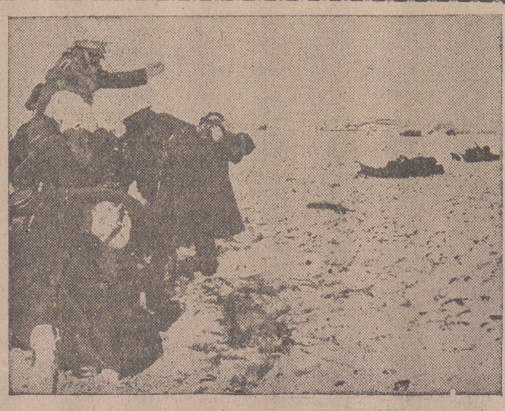
La Infantería alemana ataca una aldea soviética ocupada por el enemigo. Un lanzabombas protege su avance

Nueva York, 24.—Las galerías Parker Bennet han subastado un boceto de un cuadro de Velázquez, adquirido en 2.200 dólares por un coleccionista norteamericano. El lienzo, de pequeñas dimensiones, es un sencillo apunte para un retrato de muchacho.—Efe.