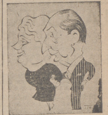
CORCHA CATALA y MANUEL GONZALEZ, que actúan con gran éxito en Lope de Vega (Caricaturas por ITO.)