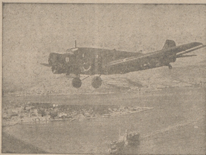
La Aviación alemana y la campaña de Africa.—Como de costumbre, el "Ju-52" se dedica al transporte de tropas a los lejanos lugares del combate.

La unidad, hecha ya realidad, en la vida y en la muerte, encontró así un símbolo, una expresión externa; lo que íntimamente estaba manifestado en la común identidad de la lucha, del heroísmo y de la muerte, tuvo y tiene un símbolo y externo manifestar. Simbolismo unificador de un gran patriotismo, de una fe nacional, de igual entrega a los destinos de España, que se encontraron en un mismo caminar en Falange Española Tradicionalista y de las JONS, es el símbolo auténtico de una unidad sagrada sellada con la sangre más valiosa de las mejores juventudes españolas.