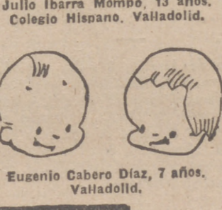
Eugenio Cabero Díaz, 7 años. Valladolid.