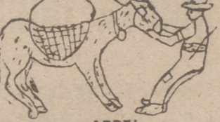
Ramón Breón Ruiz, 9 años. Escuela de Villavino (Palencia).