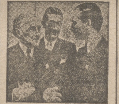
ABEL BONNARD, destacada personalidad de la literatura francesa y autor de athenas obras filosóficas-morales de señalada belleza idiomática, en animada conversación con el profesor Breker y el escritor André Fraigneau (en el centro)

Minutos antes de las once y media dió comienzo la santa misa en el cementerio de los Héroes. El altar, situado al pie del monumento al capitán Cortés, aparecía ricamente adornado, y en su frente lucía la enseña nacional. A ambos lados se habían fijado dos lápidas: de mármol con los nombres de los defensores que están allí sepultados, y en el centro, junto al altar, la tumba del capitán Rueda, que había mostrado expreso deseo de ser enterrado junto a los caídos en dicho sagrado lugar. El recinto aparecía en su mayor parte ocupado por (Pasa a la tercera página)