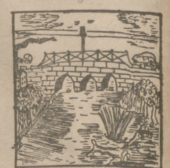
Lucio Caballero, 13 años.—Cienfuegos