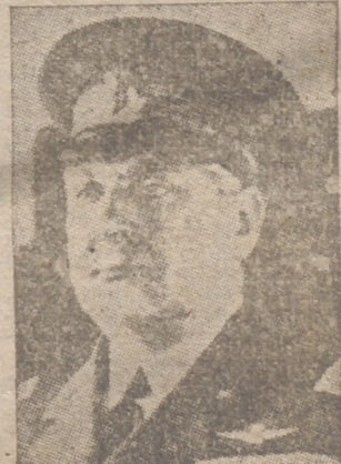
El general italiano Pintor, víctima también de un accidente de aviación