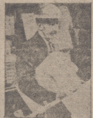
Este vendedor de periódicos de Londres sigue en su puesto durante las alarmas. "Soy un fatalista y cuando llegue el momento, poco importa el sitio. Además, no puedo privar de noticias al público", dice. Pero alguien le ha preguntado qué es eso de fatalista... con casco protector.