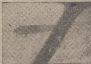
Los bombarderos italianos participan en la ofensiva aérea sobre Londres.—Volando sobre la Mancha entre nieblas.

Washington, 22.—El presidente Roosevelt ha declarado de nuevo, por medio de su secretario, que los aparatos especiales para el lanzamiento de bombas, de marca norteamericana, no serán enviados a Inglaterra. Estos aparatos "Norden", utilizados en los Estados Unidos, permanecen en secreto como hasta ahora.—Efe.