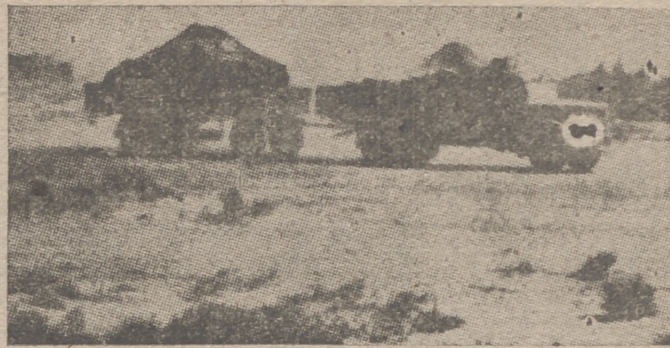
Transporte de municiones a través del desierto de Marmarica

Cartagena, 22.—Con motivo de la festividad de Santa Cecilia, Patrona de los músicos, se ha celebrado en la iglesia de la Caridad una función religiosa en la que actuó la Orquesta Sinfónica cartagenera, creada por la C. N.S. Se interpretaron escenas cartageneras y estampas marinas. Al acto asistieron representaciones de F. E. T. y de las Jóns y de la C. N.S.—Cifra.