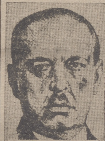
El conde Csaky, presidente del Consejo de ministros de Hungría, que orienta a su pueblo hacia la prosperidad al lado del Eje.

Los aviones enemigos han bombardeado Assab, sin causar víctimas ni daños graves en el poblado indígena. Tampoco hubo víctimas ni daños en Massaua, Decamere y Asmara. En Hargeisa causó un muerto y cinco heridos.