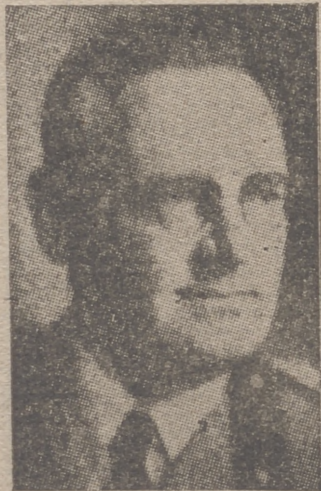
El general Soddu, comandante en jefe de las tropas italianas en Grecia.

A continuación habló de la unidad de destino de todo lo español. Dijo que tanto los productores como los obreros que aportan su mano de obra deben establecer una íntima colaboración en beneficio de la Patria. Expuso la validez del factor humano en el Sindicato y explicó la necesidad de sensibilizar al Estado en los fenómenos económico-sociales. Terminó animando a todos a una solidaridad total bajo la dirección del Caudillo.—Cifra.