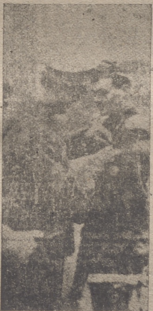
El príncipe de Piemonte condecora a uno de los soldados del Imperio.

Córdoba, 22.—Educación y Despliegue, en honor de Santa Cecilia,