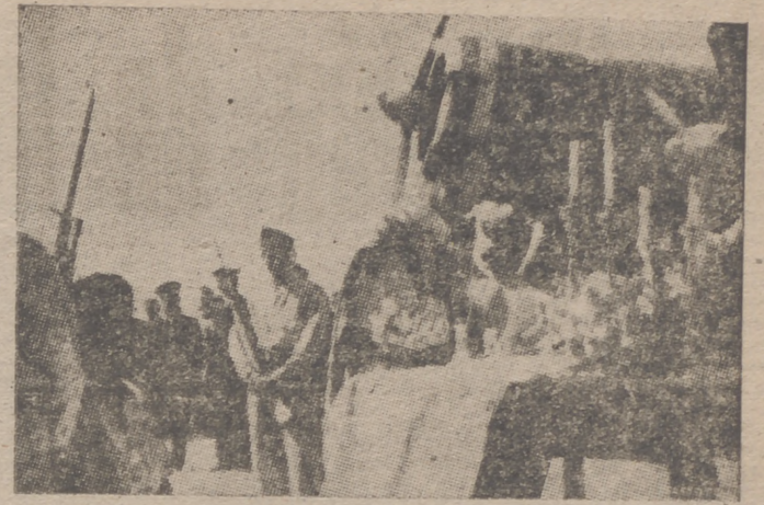
MISA EN UN CAMPO DE AVIACION ITALIANO

Berlín, 22.—El jefe del Estado rumano, general Antonescu, ha depositado una corona en el monumento a los muertos de la Gran Guerra. Iba acompañado por el ministro de Negocios Extranjeros, príncipe Sturdza, y por el representante diplomático de Rumanía en Berlín. Una compañía militar rindió los honores acostumbrados.