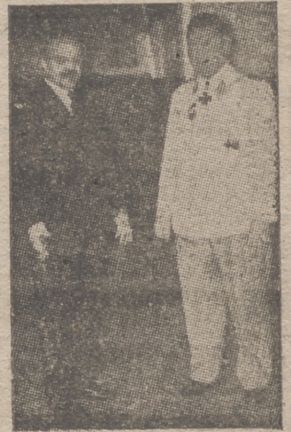
Molotov, durante el coloquio con Goering.

Nueva York, 22.—Contra la ilusión de que Inglaterra ha ganado ya la guerra, ilusión que albergan los medios canadienses, ha reaccionado hoy el ministro de Hacienda del Canadá, quien ha puesto de relieve el peligro enorme que significa un poderoso enemigo.—Efe.