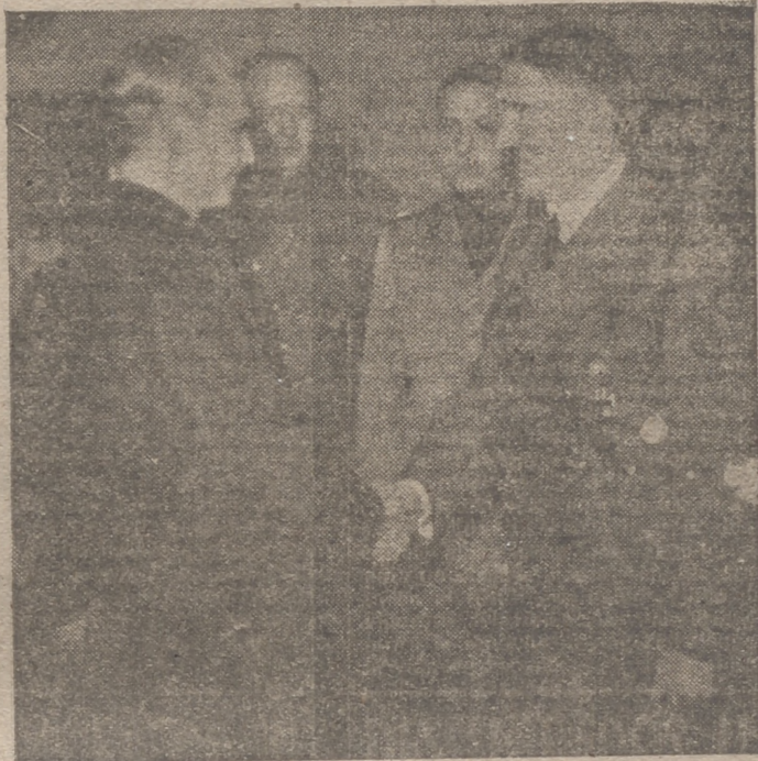
El Führer y el ministro de Asuntos Exteriores de España, Serrano Suñer, saludándose en Berchtesgaden al iniciar su conferencia. Al fondo aparece el ministro italiano, conde Ciano

New Kensington (Pensilvania), 22. La huelga de la "Aluminium Company of America" se ha declarado porque la Empresa se negó a despedir a un empleado que había golpeado a un representante sindical. La Compañía en cuestión es la única productora de aluminio de los Estados Unidos, y sus fábricas trabajan las 24 horas del día para servir los pedidos de la defensa nacional y, especialmente, los de la aviación.—Efe.