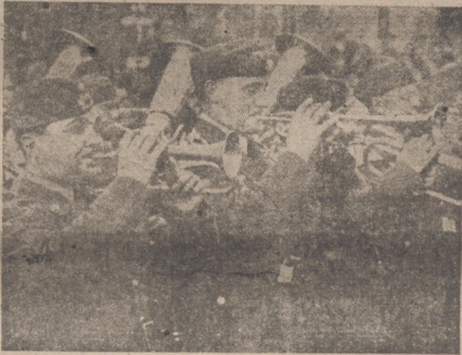
Aviadores italianos y alemanes dan un concierto en las calles de Bruselas

REVISTA NACIONAL DE ECONOMIA AGRICOLA. Defensa y fomento de la producción agraria, de su comercio e industrias derivadas. — Publicación mensual, con suplementos semanales informativos de los mercados nacionales y extranjeros. — Suscripción: 30 pesetas año. — Redacción y Administración: Av. del General Franco, 2. Tel. 1740 VALLADOLID