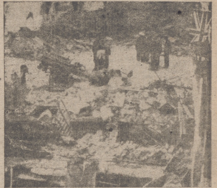
Destrozos causados en Londres por la aviación alemana

El Gobierno inglés participa la pérdida de seis barcos