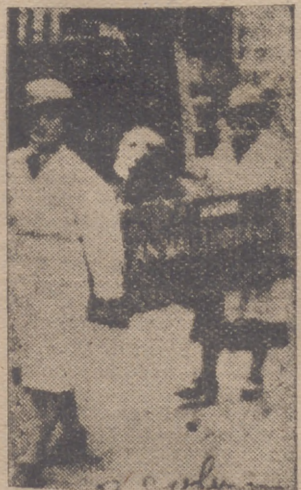
En Londres hay ambulancias, como la que se ve en esta fotografía, dedicadas al transporte de animales heridos en los ataques aéreos.

Roma, 16.—El Nuncio en España, monseñor Cicognani, ha visitado al Cardenal Tardini, secretario de la Congregación de Asuntos Eclesiásticos Extraordinarios del Vaticano. Se cree que mañana será recibido por el Papa en audiencia privada.—Efe.