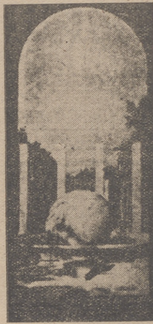
Entrada a la Exposición de expansión española en el Mundo.

Calles enteras fueron destrozadas por el bombardeo, en el que fueron arrojadas más de mil toneladas de bombas, sin que ninguno de los medios de defensa ingleses pudiera impedirlo.—Efe.