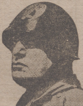
Los hechos, por fin, han roto el silencio del hombre que tenía pendiente de su palabra al mundo entero

Roma. - Discurso de Mussolini. - "Combatientes de tierra, de mar y de los aires. Camisas negras de la revolución y legiones de hombres, mujeres de Italia, del Imperio y del reino de Albania. Escuchad: La hora marcada por el destino suena en el cielo de nuestra Patria. (Aclamaciones entusiastas.) Es hora de decisiones irrevocables. (Nuevas aclamaciones.) La declaración de guerra ha sido ya entregada a los embajadores de Inglaterra y de Francia. (Nuevas y formidables aclamaciones.) Entramos en guerra contra las democracias plutocráticas y reaccionarias de Occidente, que en todo tiempo han entorpecido la marcha de Italia y muchas veces han amenazado incluso la propia existencia del pueblo italiano."