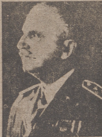
La majestad del Rey-Emperador Victor Manuel III, que ayer firmó la declaración de guerra a Francia e Inglaterra