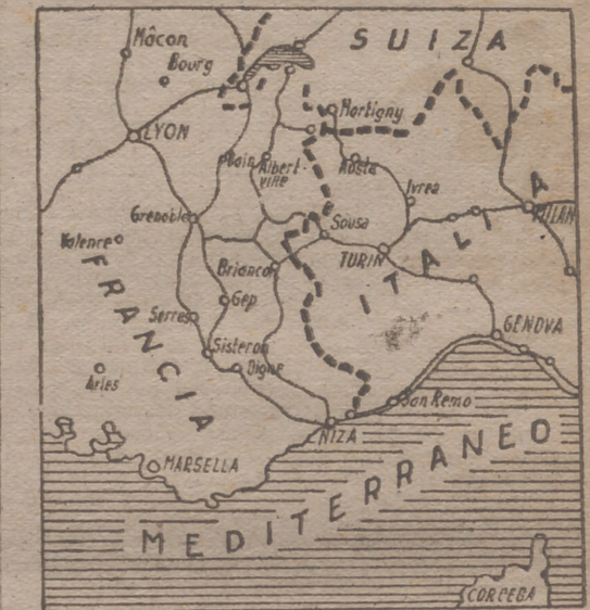
Este es el frente europeo francés, uno de muchos que se han abierto al mundo, a través de la intervención italiana.

En nuestros corazones viven intactos los sentimientos de solidaridad con la verdadera España y con los principios que determinarán esta misma solidaridad. A la luz de esos principios y de esos sentimientos medimos en toda su extensión el valor presente y futuro de las dos naciones peninsulares. Protégelas, Dios, a ambas y, como en todas las horas inmortales en que supieron permanecer juntas y amigas, encaminen su paso al servicio de aquellas ideas que dieron grandeza y gloria a sus destinos en el mundo. Seguidamente el embajador de Portugal cedió a colocar a S. E. el escudo de Portugal y a continuación el general pronunció las siguientes palabras: Señor embajador: vuestras cariñosas palabras hacia mi nación y mi persona, reflejo del afecto caballeroso de vuestra nación, ha de tener en nuestro pueblo el mas cálido sentido de los ecos. La amistad que hoy estrechan nuestras naciones ha prevalecido siempre en nuestra Historia. Desde los albores de los tiempos viven nuestros pueblos en sus luchas seculares contra los invasores.