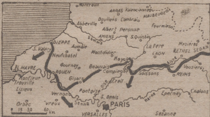
El Havre y París son los objetivos de la gran ofensiva alemana. La presión de los germanos, indicada con flechas, presenta aspectos bien peligrosos para ambas plazas