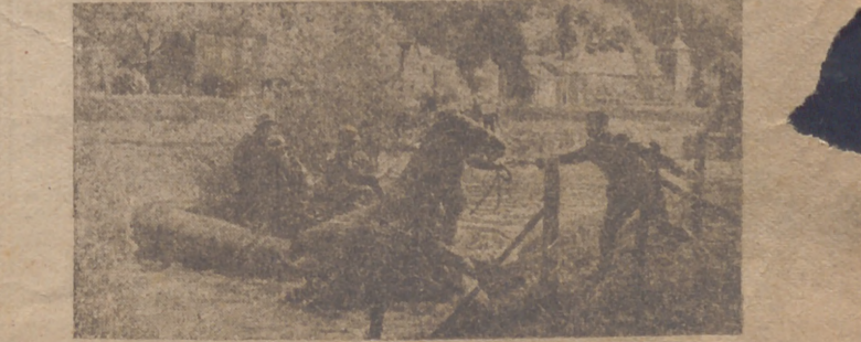
EN EL FRENTE OCCIDENTAL. Mientras los zapadores alemanes se apresuran a sustituir el puente volado por otro provisional, las avanzadillas cruzan el río en lanchas neumáticas.

Madrid, 31.—La Comisaría General de Abastecimientos y Transportes sale al paso de un rumor circulado en estos días sobre un posible aumento en el precio de determinados artículos de vestir. A este fin y para impedir que gentes indeseadas logren su objetivo de sembrar alarma entre el público y evitar la especulación de algunos industriales, se ha creado una comisión para evitar perturbaciones de este género. Se hace saber que, en absoluto, se fundamentan los rumores y se sancionará a los propietarios que intenten, así como a