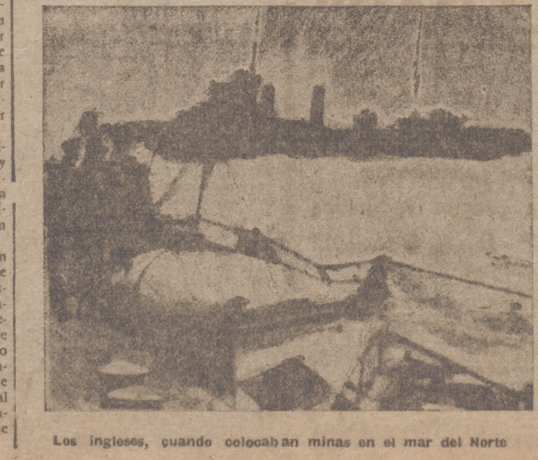
Los ingleses, cuando colocaban minas en el mar del Norte