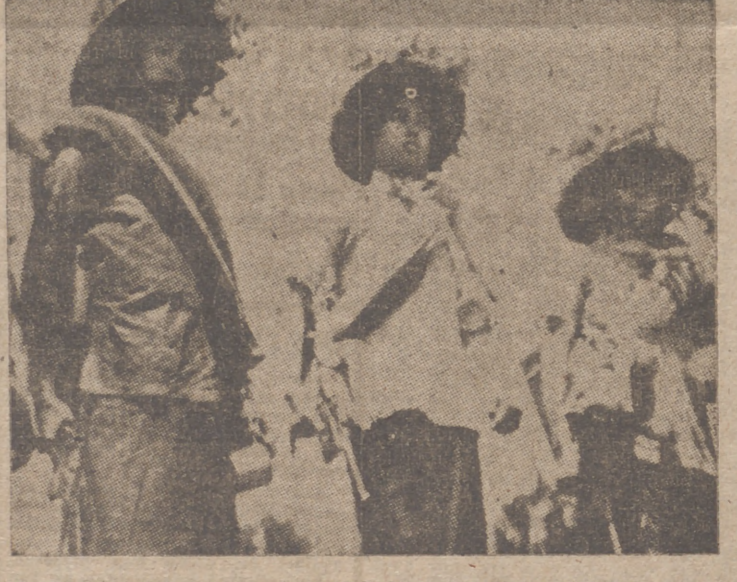
Muchachos soldados del Ejército de Chang-Kai-Shek