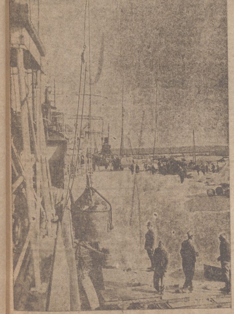
DURAZZO.—Embudo del mineral de cromo extraído del suelo albanés y dirigido a Italia en la motonave "Neghellii"