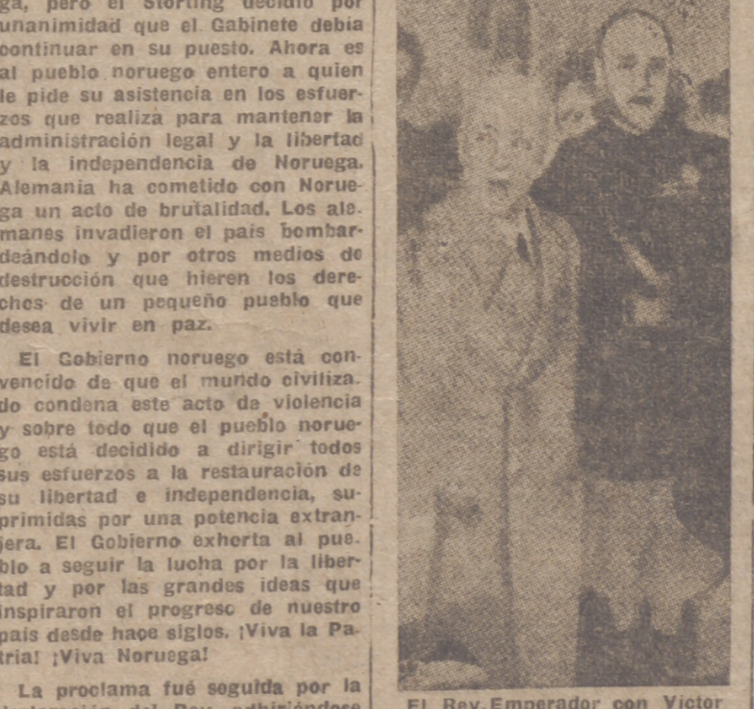
El Rey Emperador con Victor Mussolini, durante su visita a la vieja Redacción de El Popolo d'Italia