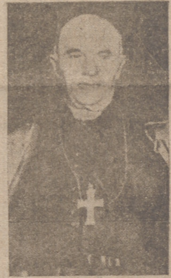
El Cardenal Verdier, que ha muerto recientemente