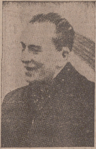
M. URBSS Ministro de Negocios Extranjeros de Lituania