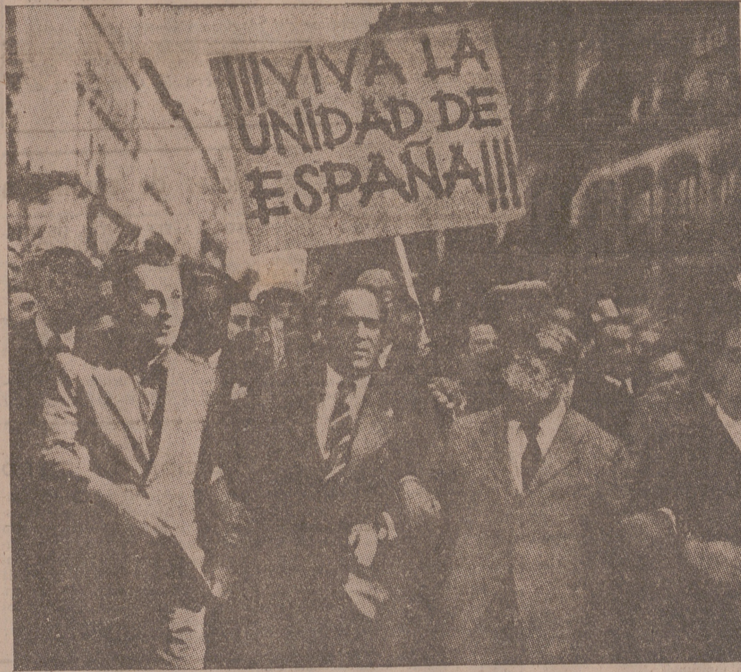
El tremendo alboroto de 1934 encontró muy pocos ecos en España. Unos nacieron para oír y otros para llorar. Y así, aquel octubre rojo, que encendió la hoguera española, cayó en la esterilidad poraue

había demasiados que querían dejar pasar la tormenta.