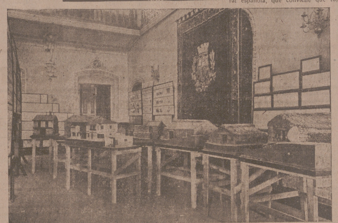
En este departamento de la Exposición, uno de los muchos que la forman, se presentan los trabajos de las provincias de Soria y Huesca: Gráficos, fotografías y proyectos de construcción de viviendas para campesinos de dichas provincias. Las maquetas son modelos de grupos de viviendas para obreros de ciudad y una casa para labrador extremeño.

en las diferentes regiones españolas: Andalucía, provincias vascogadas, Galicia, etc., se tiene igualmente su ficha. En este fichero constan también las viviendas destruidas durante la guerra. La labor que con él se puede hacer abreviará muchísimo la de reconstrucción, ya emprendida. Y eran más de 4.691 las viviendas que a los veinte meses de guerra constaban, registradas, como destruidas. ALGUNOS DATOS CURIOSOS Una de las circunstancias por las que aún no se ha inaugurado la Exposición es porque aún no se han instalado los trabajos realizados por las provincias de Andalucía, en donde se ha hecho bastante labor higiénico-sanitaria de la vivienda. Son dignos de señalar en la Exposición los curiosos gráficos relativos al movimiento de alquileres, al número de viviendas clausuradas por insalubridad, a las cuevas habitadas en toda España, al número de inspecciones realizadas, etc., etc. En España—registradas—hay 577.535 y 275.284 sin ella. Y 629.228 viviendas con alcantarillado y 223.532 sin él. Consecuencia: en nuestra patria hay todavía 45.654 pozos negros. "ASI VIVE EL CAMPESINO ESPAÑOL..." Salimos del recinto en que se va a celebrar la Exposición de la vivienda rural. Los salones están divididos en compartimentos por paneles a modo de carteles murales, en