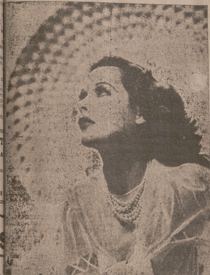
Reciente fotografía de la bellísima star, Hedy Lamarr

na película sobre la bula "Blanca Nieves y siete enanos" rodada en Alemania