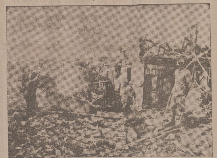
Los soldados japoneses, después de un bombardeo, ocupan un pueblo chino y realizan la previa labor sanitaria

extiende aún la etapa difícil de unos cuantos años de consolidación política, de trabajo enérgico, de sacrificio. Nada sería más peligroso que considerar que una simple victoria previa como la que ya hemos logrado agota totalmente la etapa preliminar: todavía estamos en los momentos difíciles, en los que el tono mejor es el de la hosquedad.