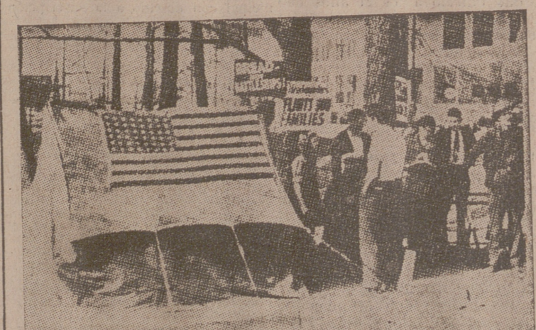
Tiendas de campaña colocadas bajo la bandera estrellada de la Unión. En estas tiendas viven 900 familias de la ciudad de Flint (Michigan), una de las zonas más ricas de los Estados Unidos

Los gobernadores del Banco de Francia y del Banco de España, así como el embajador español en Francia, señor Lequerica, presenciaron el cargamento del oro en los camiones.