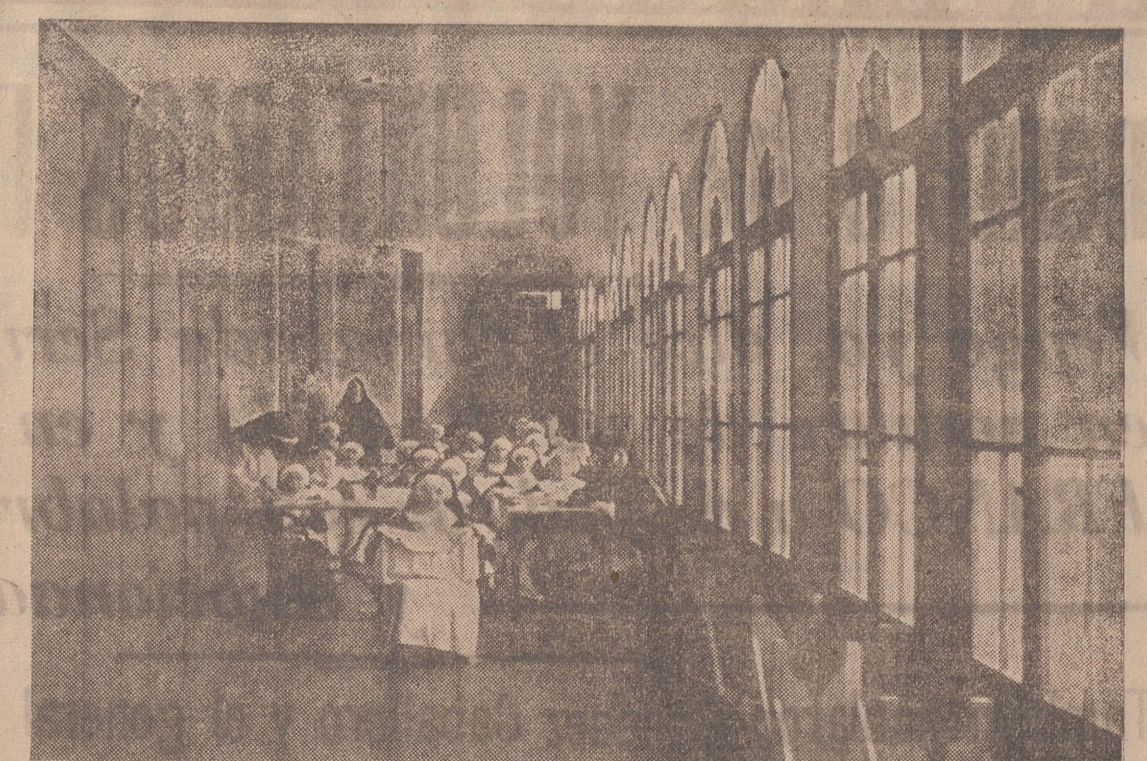
UNA HABITACION DE TRABAJO

Celebran hoy las Religiosas Oblatas del Santísimo Redentor sus bodas de diamante, es decir, hoy primero de junio, hace 75 años que se fundó su Congregación. No es este momento y lugar a propósito para describir las dificultades y circunstancias adversas que rodearon a la idea de la fundación y primeros pasos de la obra admirable de redención en el propio sentido de la palabra, que llevan a cabo estas abnegadas religiosas. Los grandes beneficios que el Señor concede a los hombres por medio de los Institutos religiosos, llevan siempre en su origen el sello de la adversidad, y en este sentido las Oblatas del Santísimo Redentor no han sido una excepción. Largo fué el proceso que, a raíz de sus frecuentes visitas a las salas del Hospital de San Juan de Dios, en Madrid, hubo de sufrir la idea de regeneración cristiana en las jóvenes caídas que germinó en el alma apostólica de aquel misionero australiano y Prelado venerable, don José María Benito Serra; más al fin encontró una mujer abnegada y sierva de Dios, que, recogiendo la nueva gracia que el Señor enviaba al mundo, comenzó y dió fin a esta gran Obra, el día primero de junio de 1864 se abrió en Ciempozuelos el primer Asilo de Arrepentidas, bajo la advocación de Nuestra Señora del Carmelo, título que la reverenda Madre fundadora, Sor Antonia de Oviedo, quiso dar a la Casa en memoria y reconocimiento de la inspiración recibida en la Catedral de San Isidro, de Madrid.