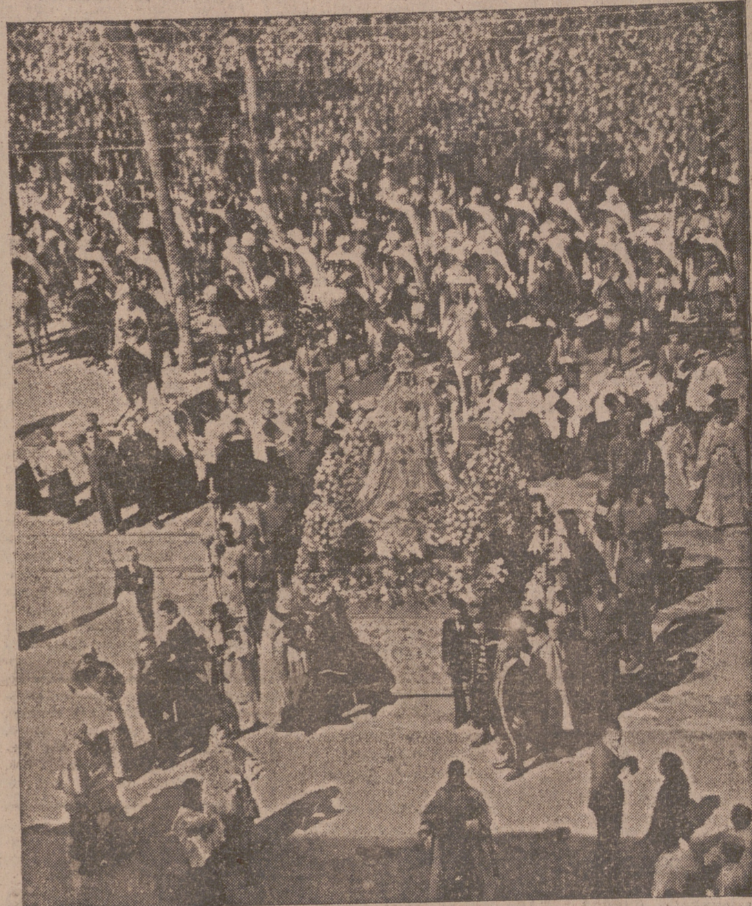
Para celebrar el final victorioso de la guerra, la imagen de la Virgen de los Reyes, patrona de Sevilla, ha sido sacada procesionalmente, con asistencia del Caudillo y representantes del Gobierno. En el cortejo figuraba la espada del Rey San Fernando, llevada por el ministro de la Gobernación. — La imagen de la Virgen de los Reyes a su paso ante el Ayuntamiento. Delante de la carroza, el ministro de la Gobernación llevando la espada del Rey San Fernando