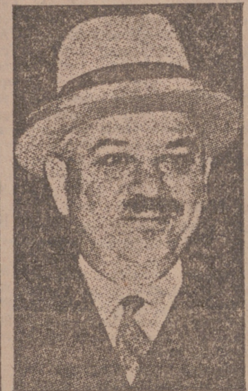
Maitsky, embajador de la U. R. S. S. en Londres, que ha celebrado importantes conferencias con los jefes del Gabinete Inglés.