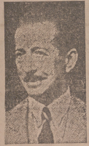
Sir William Seeds, embajador de Inglaterra en Moscú, que ha celebrado varias entrevistas con el comisario soviético del Exterior, Litvinov, para ofrecerle, en nombre de su país, un ventajoso pacto aéreo.