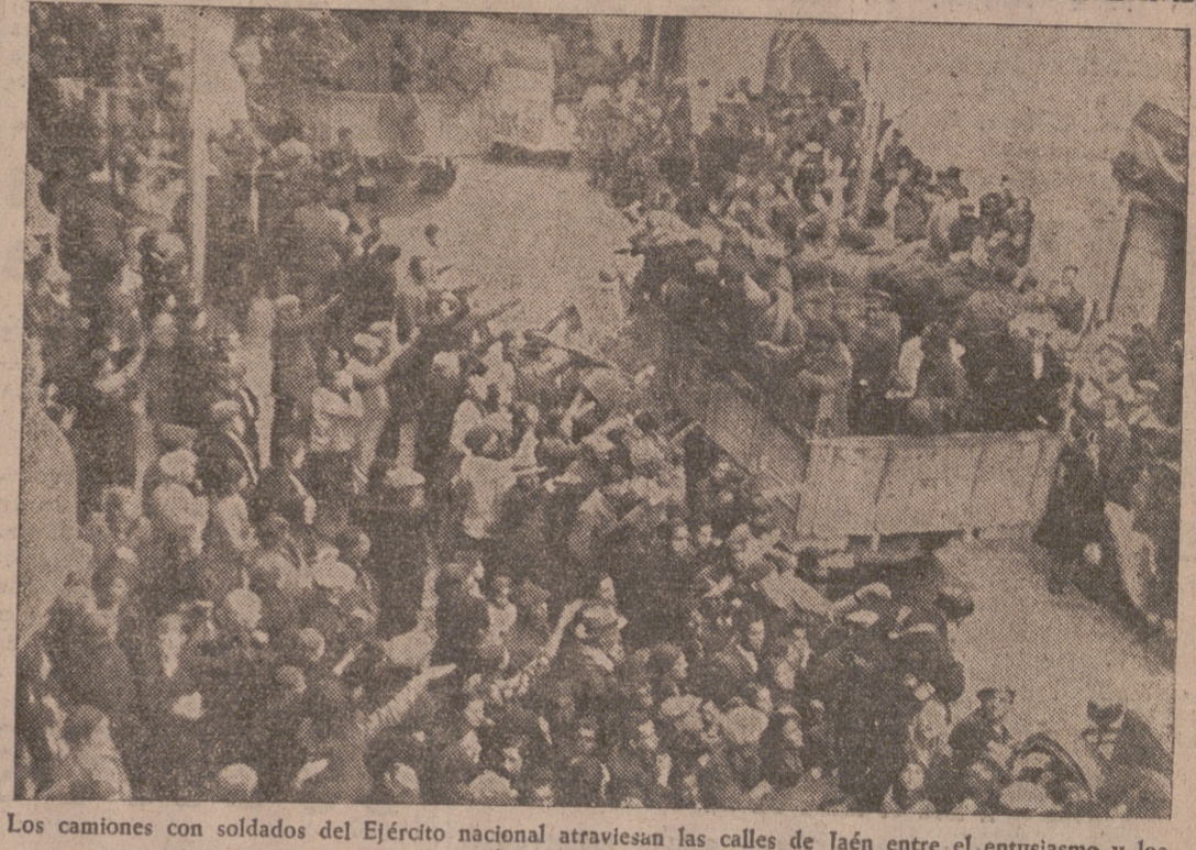
Los camiones con soldados del Ejército nacional atraviesan las calles de Jaén entre el entusiasmo y los vítores del vecindario