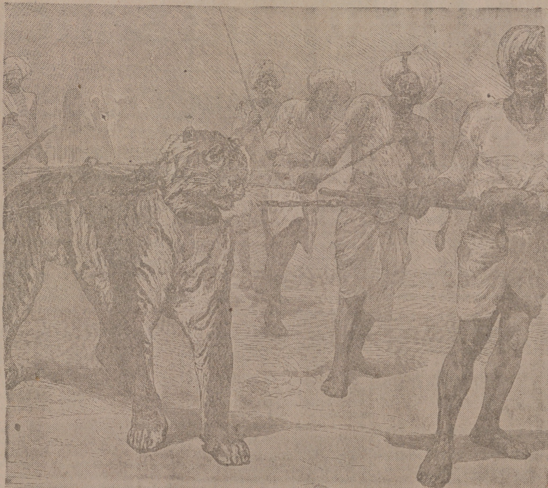
El tigre, cazado por los diestros, es conducido encadenado ante los mayores