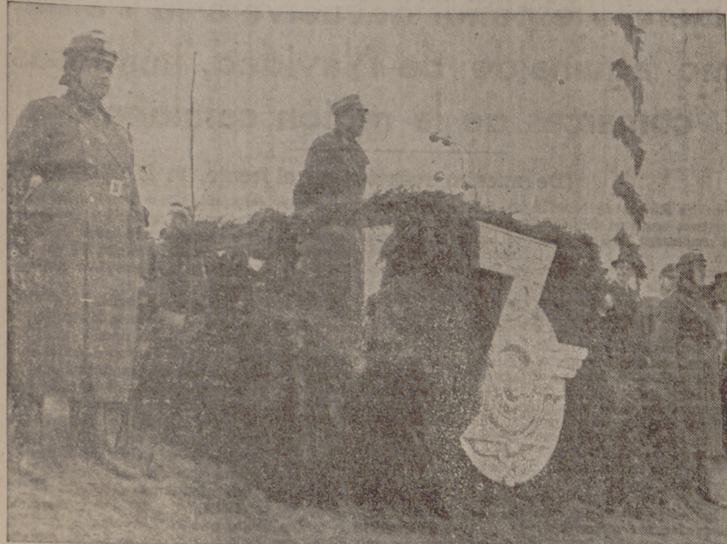
Ultimamente se inauguró el trayecto de las autopistas alemanas desde Berlín-Centro hasta Rangsdorf, de modo que se pueden utilizar ahora tres mil kilómetros. El jefe-constructor, doctor Todt, dirige la palabra a los tres mil obreros que han sido agasajados con motivo de la inauguración.