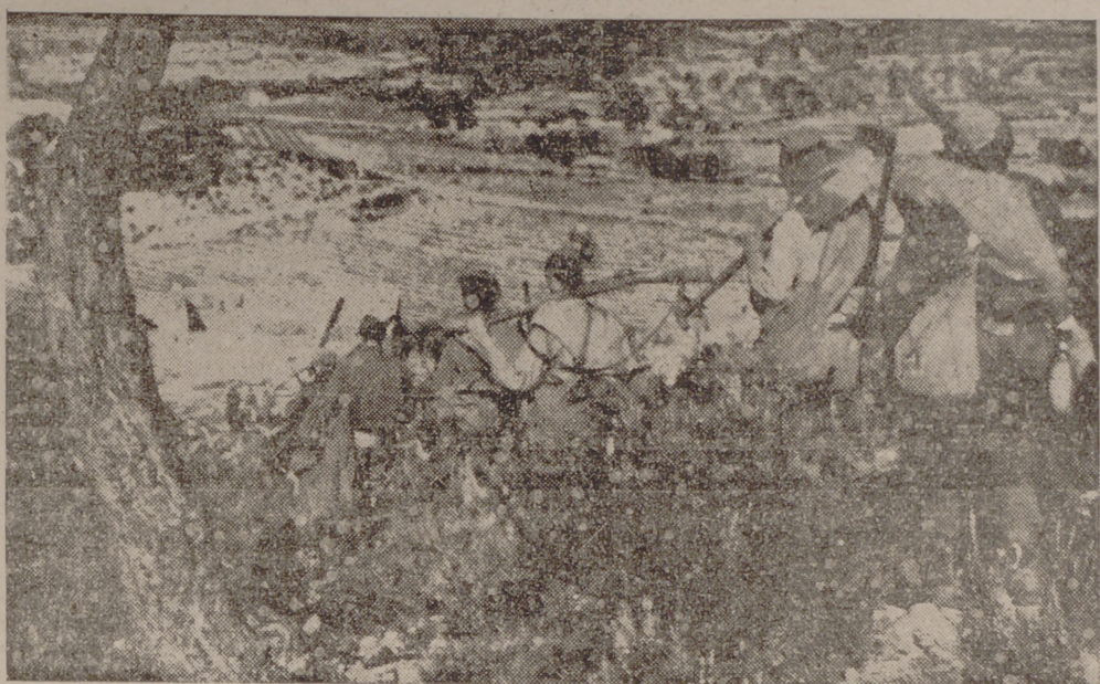
Nuestros soldados en marcha

...porque los rojos no nos vieran desde el instante primero, dificultando con sus automáticas nuestra escalada, se mandó por una dirección de marcha a la derecha y a la izquierda, partiendo del punto que llega al río, alcanzado por sorpresa y sigilosamente durante la noche. Una sección se descolgaba sobre el mogote, en tanto que un crecido número de ametralladoras anularían el brazo de fuego que amenazaba nuestro flanco izquierdo. Todo estaba dispuesto cuando un día de sol magnífico señaló el siguiente como fecha de la rotura del frente rojo.