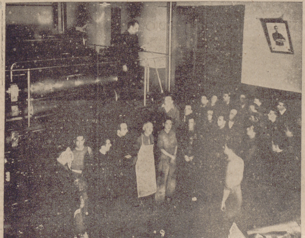
Al comenzar la jornada normal de trabajo fué leída la lección de José Antonio en nuestros talleres por el camarada director de LIBERTAD, estando presentes todos los redactores del periódico, personal de administración y obreros de talleres y fotograbado. Después de la lectura se cantó el himno de la Falange y se dieron los presentes a José Antonio.