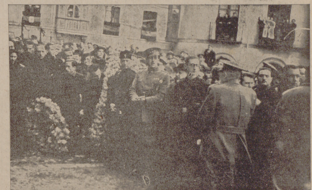
DIVERSOS ASPECTOS DE LOS ACTOS CELEBRADOS AYER

HOSTERIA Burgense Restaurant de primer orden BURGOS