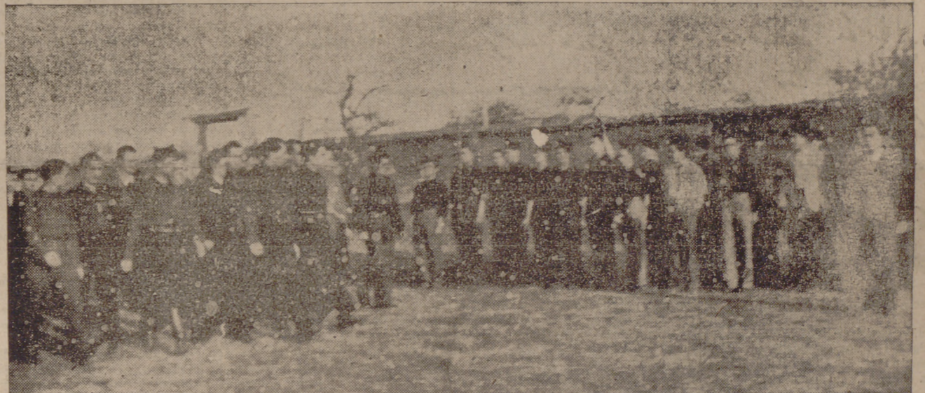
En posición de firmes, las centurias forman orgullosas para ser revistadas por quien infundió en ellas una ambición heroica por la que muchos de sus camaradas supieron morir y por la que fué posible un entregarse-como él-por completo a España.

Aquí aparecen juntos él y Onésimo, tan inquebrantablemente unidos en una amistad, y sobre todo en una idea y en una fe por la que vivieron y murieron.