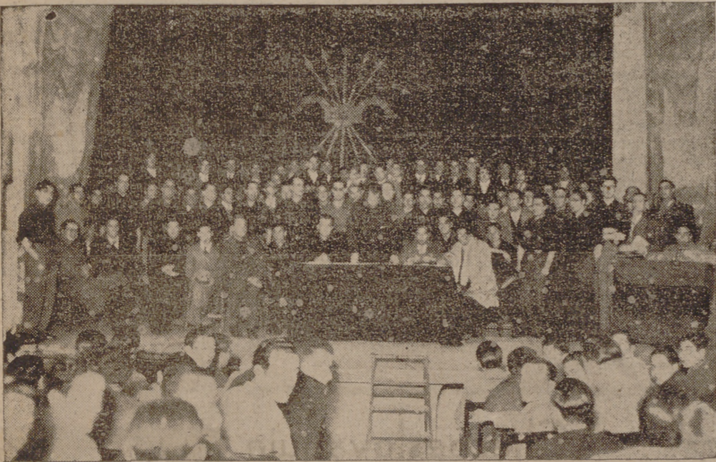
20 DE ENERO DE 1935

Horas-antes de aquel histórico acto de la unión de Falange Española con las Juntas de Ofensiva Nacional-sindicalista, los jonsistas de Valladolid salieron a los caminos a recibir a su jefe. Y un bosque de brazos-extendidos en prueba de sumisión absoluta y total-le recibió a su entrada en la cuna del Nacional-sindicalismo.