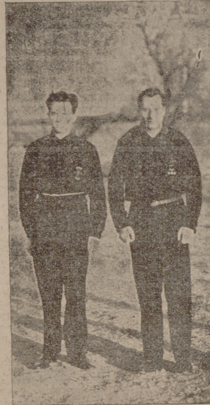
3 DE MARZO DE 1935

4 DE MARZO DE 1934 20 DE ENERO DE 1935 4 DE MARZO DE 1935