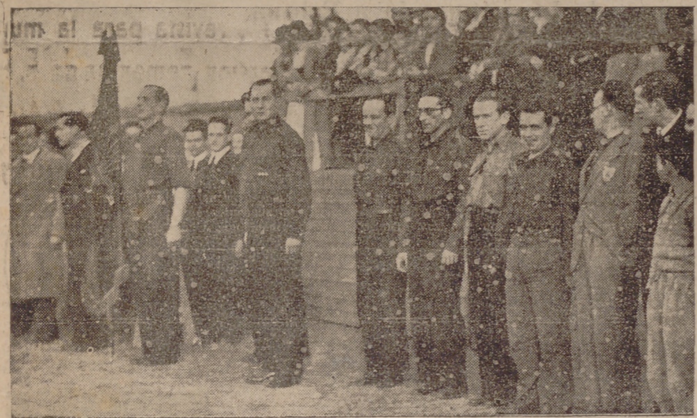
3 DE MARZO DE 1935

En el Teatro-Cine Hispania, y en la primera Asamblea general del S. E. U., la palabra del jefe y maestro fué escuchada por la juventud falangista vallisoletana. Y prendió tan fecundamente como la primera vez que nos arrastró con su voz.