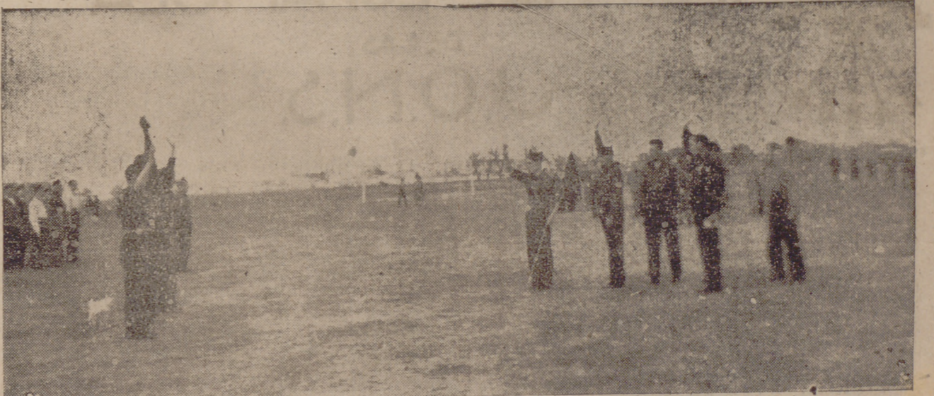
José Antonio, ante el guión Nacional-sindicalista de la Falange vallisoletana, levanta su brazo de conductor y da los gritos que fueron consigna y meta por las que una juventud luchó guiada por su ejemplo.