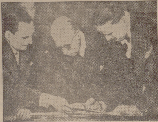
Lord Perth (en el centro) en el momento de firmar el acuerdo

"Le Jour" supone que el Gobierno se ocupará mañana de cuestiones de política exterior. Sin embargo, la cuestión de mayor interés para el Consejo será la preocupación de hallar una nueva mayoría parlamentaria.