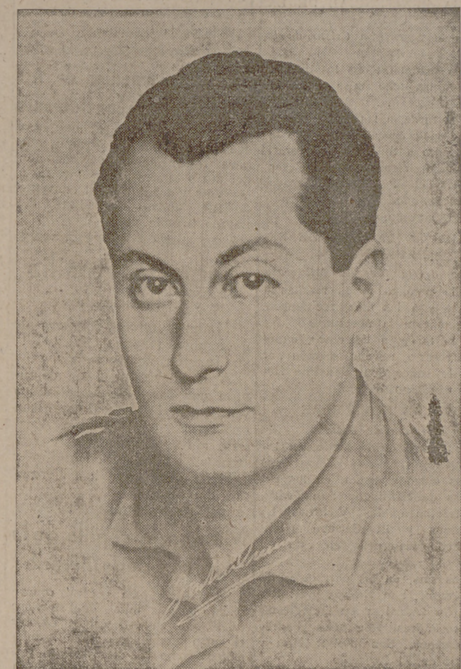
José Antonio, jefe inolvidable de la Falange, cuya vida y cuya muerte será para siempre ejemplo insuperable

Los necios de un campo y de otro aseguraban que aquel "gran jefe de España" no podría ser nunca el jefe de la revolución nacional sino el jefe de la revolución nacionalista. Según ellos, los líderes habían de mirar con recelo a un letrado refinado que no