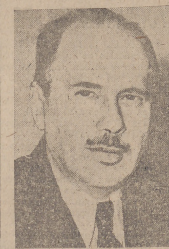
El señor Hugh Wilson, embajador de los Estados Unidos en Berlín

TEATRO NACIONAL DE LA FALANGE. PRESENTACION DE LA NOTABLE COMPANIA DEL TEATRO NACIONAL DE FALANGE ESPAÑOLA TRADICIONALISTA Y DE LAS IONS EL MARTES Y MIERCOLES PROXIMOS EN EL TEATRO CALDERON, A LAS 7 DE LA TARDE Y 10,30 DE LA NOCHE