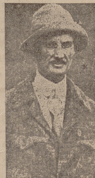
El célebre profesor Piccard, que fué el primer hombre que se elevó a la altura de 16.300 metros, y que actualmente ensaya la manera de alcanzar grandes profundidades marinas