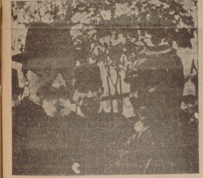
El célebre misionero francés, del que partió la iniciativa de organizar en China las zonas de seguridad, está en Hankou. Aquí se le ve en compañía del jefe de las tropas japonesas que ocuparon la ciudad.