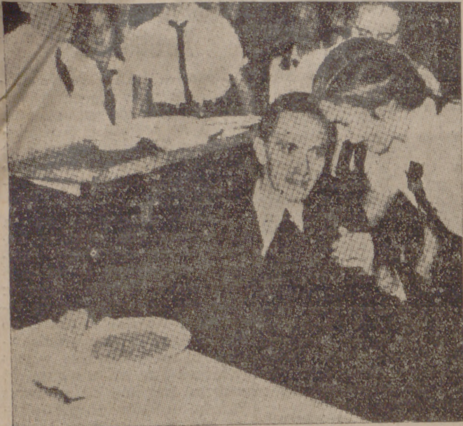
Gorbels en la comida organizada por los muchachos voluntarios adheridos a la obra de asistencia, en la que pronunció un magnífico discurso hablando de la acción disolvente del judaísmo internacional