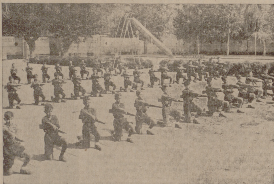
Un grupo de Flechas haciendo instrucción en las Moreras

Comienza la gimnasia con movimientos sencillos, pero poco a