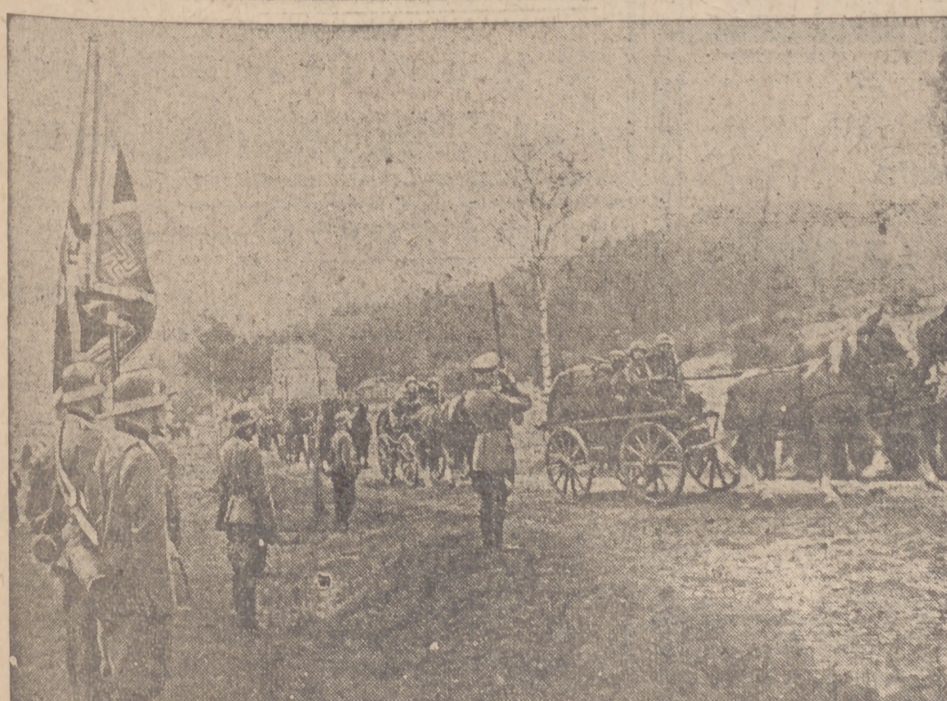
El general von Leeb, comandante en jefe de la ocupación del territorio sudete, asiste a un desfile de convoyes alemanes cerca de la ciudad de Glockeber.