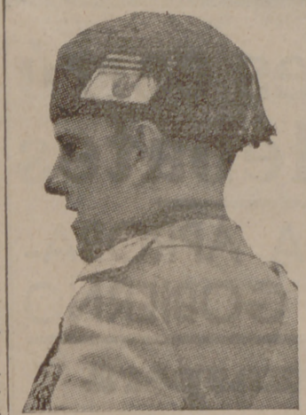
Conde de Ciano