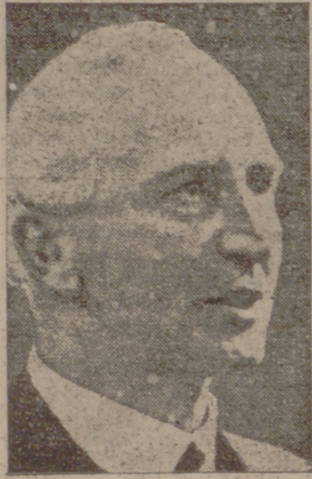
Sir John Simon

Londres.—Al reanudarse el debate sobre la situación internacional en la Cámara de los Comunes, Sir John Simon presentó una moción, en medio de grandes oraciones, solicitando de la Cámara la aprobación de la política del Gobierno, por medio de la cual la guerra ha