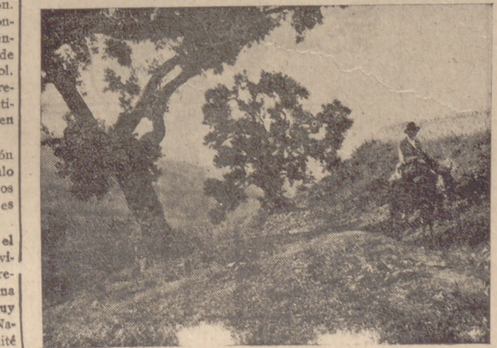
En la Sierra Nevada