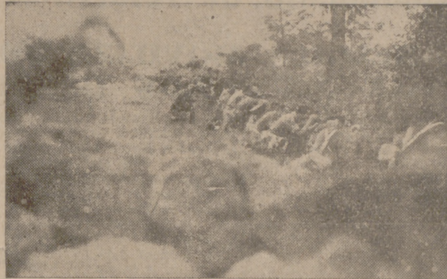
Parapeto de falangistas en el frente catalán

La palabra "nacional" no es en nuestros labios un tópico; tiene un sentido profundo, definitivo, porque puede decirse que toda la juventud redimida y emancipada y que tiene capacidad para levantar la cara al sol de España, está con nosotros.