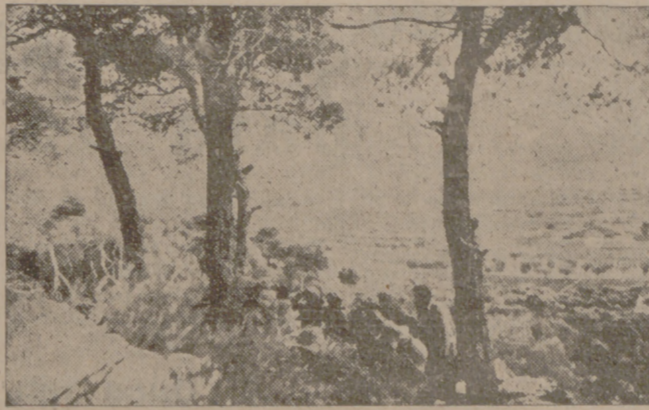
Puesto de observación en el Ebro