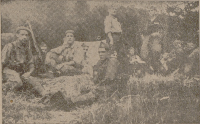
Tropas en descanso en el Ebro