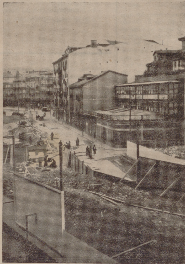
El «Servicio de Trabajo» de Falange, reconstruyendo las ciudades liberadas